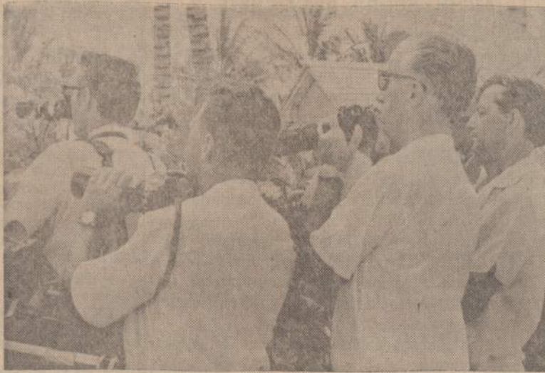
Lucy B. Johnson ir Patrick Nugent medaus mėnesį leidžia Bahamas saloje. Laikraštiniškai neprifeidžiami prie prezidento dukters vasarvietės. Fotografai, atsinešę toliažiuores kameras, bando pagauti naujavedžius iš kitos salos, bet jiems nevyksta. Iki šio meto dar nepavyko jaunavedžių nufotografuoti.

SKAITYK PATS IR PARAGINK KITOS SKAITYTI DRAUGAS IR BŪCIULIS