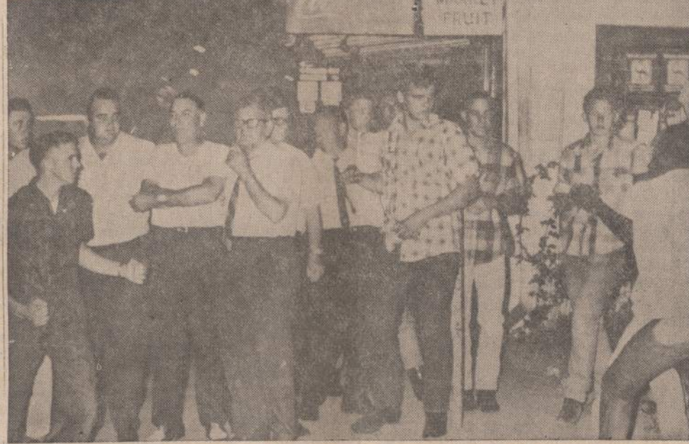
Grenada, Miss., miestelyje rugpjūčio 9 ir 10 dienomis įvyko smarkus susirėmimas tarp baltųjų ir negrų. Paveiksle matome susirėmimų pradžią. Muštynėse dalyvavo 350 vyrų, didokas skaičius buvo sužeisti, teko vežti juos į ligoninę.