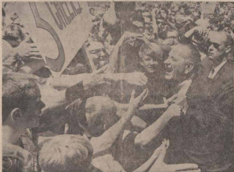
Prezidentas Johnsonas, nuvykęs į Manchester, N.H., ir sutikęs kelis senus savo pažįstamus, skardžiai nusikvatojo. Paveiksle matome prezidentą, besikalbantį su Manchesterio miestelio ir jo apylinkių politikais ir valstybės pareigūnais.

KAIRAS. — Egipto saugoma taryba nutėisė 7 moslemų partijos vadus mirties baudmėmis.