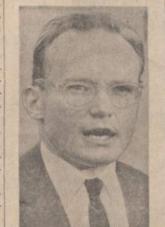
McGeorge Bundy mano, kad JAV turėtų turėti neprekybinę televizijos stotį. Dabar veikiančios TV stotys labai daug vietos skiria garsiniams. Bundy mano, kad galima būtų finansuoti nekomercinę TV stotį.