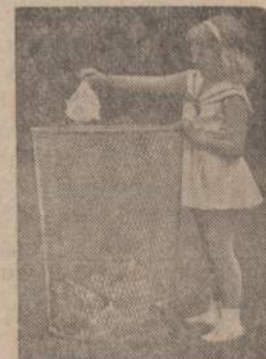
Susan Spottless says: KEEP AMERICA BEAUTIFUL