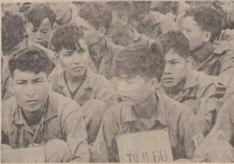
Šiaurės Vietnamo valdžia siunčia į pietus 17-18 metų vaikus. Pleiku srityje buvo paimti nelaisvės paveikslė mofomi 17 metų berniukai, kurie buvo mobilizuoti šiaurėje, truputį apmokyti ir pasiūti kovoms.

BELGRADAS. — Jugoslavijos prezidentas Tito savo kalboje kariuomenei, pareiškė, kad priešai iš užsienio remia socializmo trukdytojus Jugoslavijoje, kurių tikslas esąs sutrukdyti Jugoslavijos socializmo pažangą.