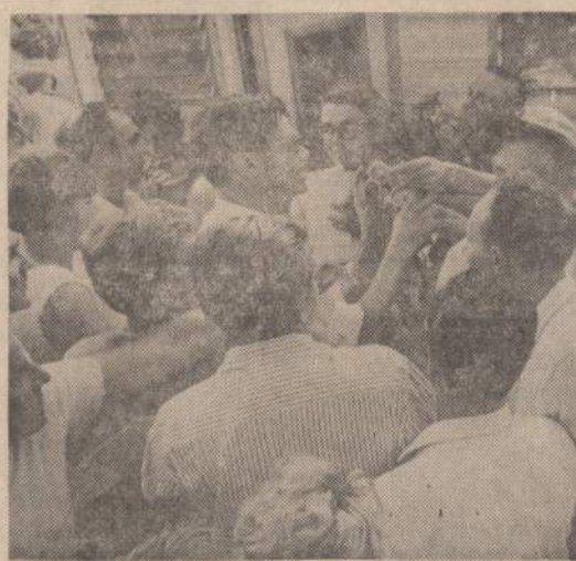
Amerikos nacių partijos vadas George Lincoln Rockwell gauna dolerius iš savo partijos draugų. Rockwell sako, kad amerikiečiai jam pinigų duoda tuo tarpu žinovai tvirtina, kad ši scena specialiai jo partijos narių paruošta fotografui.

OSLO. — Vakarų Vokietijos kancleris Erhardas sekmadienį vyksta į Norvegiją, kur jis viešės keturias dienas.