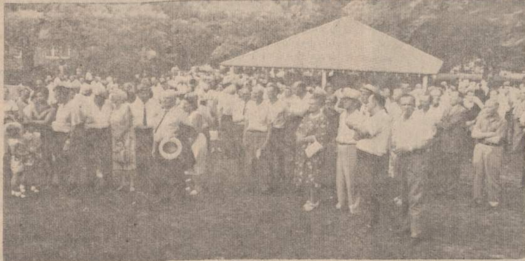
Rudeninio Naujienų pikniko vaizdas. Vietomis praėta sėkmadienį smarkiai lijo, bet Naujienų piknike oras buvo gana gražus, o kartais saulė pramušdavo debesis ir gražiai apšviėdavo visa Bučo sodą.