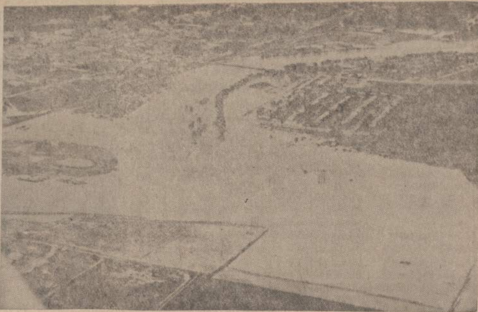
Pakilus New Meksikos upių vandenims, pradėjo semti Carlsbad, N. M., miestelį. Vanduo apsemė upės pakraščiuose esančius sodus ir kelis pastatus.

Vliko aplinkumoj dabar atostoginės nuotaukos. Gal tos nuotaukos kiek atmiestas Pasaulio Lietuvių jaunimo kongreso priimtomis rezoliucijomis. Ne juokai! Jaunimas pareikalavo rudenio VLIKo perorganizuoti pagal jų "de-