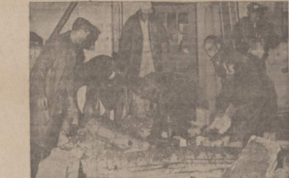
Texas valstijoje, Plainview mieste nepažįstamų asmenų buvo padėta bomba. Vienas negras buvo užmuštas ir 41 sužeistas. Ugniagesiai tikrina, kad po lauzų kartais nebūtų sužeistų žmonių. Policija aiškina sprogdintojus.

RADIJO ŠEIMOS VALANDOS Visos programos iš WOPA, 1490 kil. A. M. Lietuvių kalba: kasdien nuo pirmadienio iki penktadienio 10-11 val. ryto. — Seštadienį ir sekmadienį nuo 8:30 iki 9:30 val. ryto. Vakarų šos: Pirmadieniais 7 v. v. Tel.: Hemlock 4-2413 7159 So. MAPLEWOOD AVE. CHICAGO, ILL. 60629