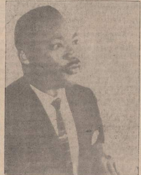
Negrų kunigas dr. Martin Luther King, pasikalbėjęs su meru Richard Daley, pranešė, kad visos negrų demonstracijos Čikagoje sustabdomos.

ČIKAGA. — Vakar Čikagos meras Richard Daley ir dr. Martin Luther King turėjo pasitarimą. Buvo apsvaistytas 19 asmenų komiteto paruoštas planas, kaip užbaigti Čikagoje namų ir butų segregaciją ir paversti Čikagą "atviru miestu". Po to pasitarimo dr. King pranešė spaudai, kad visos negrų demonstracijos Čikagoje yra sustabdomos. Atidedamas ir negrų žygis į Cicero, kur jie turėjo demonstruoti rytoj, sekmadienį. Dr. King pareiškė, kad negrų teisių judėjime Čikagoje padaryta didelė pažanga, nors tai esąs tik pirmas žingsnis ilgame kelyje. Smulkmenų, kokių lengvatų negrai Čikagoje išsiderėjo, dr. King nepranešė.