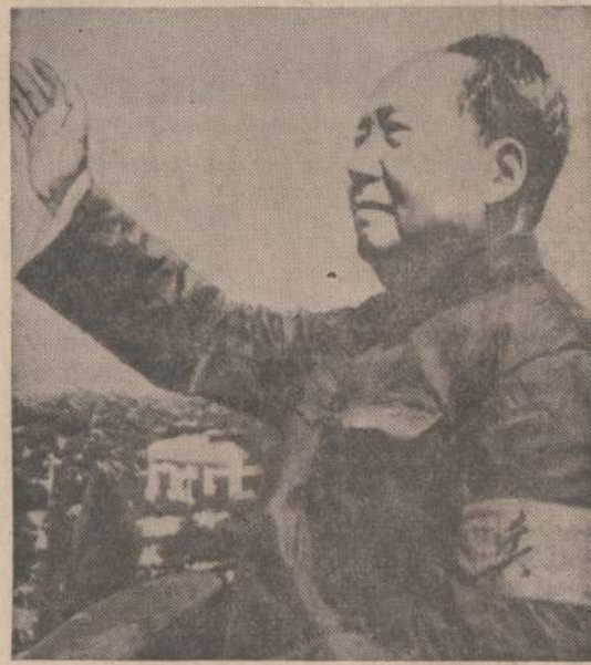
Maocetungas kalba Pekine susirinkusiems žmonėms. Jis aiškina kiniečiams, kodėl jis buvo priverstas praeiti partijos narių ir valstybės pareigūnų valymą.

Tiktai 1956 metais, mirus Stalinui, Lenkijos komunistinis premjeras Cyrankiewicz paskelbė, kad visi naminės armijos daliviai, kurie iki to laiko buvo ignoruojami, ateityje gaus pensijas ir garbės ženklus, kaip ir visi kovojusieji už Lenkijos laisvę.