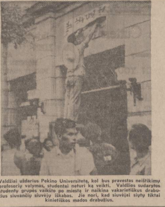
Valdžiai uždarius Pekino Universiteta, kol bus praveistas neištikimų profesorių valymas, studentai neturi ką veikti. Valdžios sudarytos studentų grupės vaikšto po miestą ir naikina vakarietiškus drabužius suvancijū siuvėjų iškabais. Jie nori, kad suvėjait siūtų tikiai kinietiškos mados drabužius.

J. D. C. "NAUJIENOS" BOLŠEVIKAMS YRA RAKŠTIS JŲ AKYSE