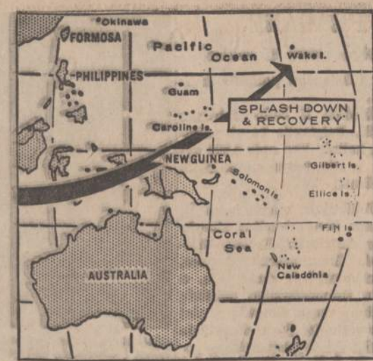
Iš Cape Kennedy pakilęs Apolo praskrido Amerikos kontinentu, skrido tarp Australijos ir Azijos, o vėliau laimingai nusileido Wake salos vandenyse, kur specialiai pasiūstas laivas ordvėlavį ištraukė.

Išimu iš švarko vidinės kišenės vizitinę kortelę ir paduoju. Laima sėdėdama paima kortelę ir kažkaip keistai, nedrąsiai pažvelgia į mane iš apacios.