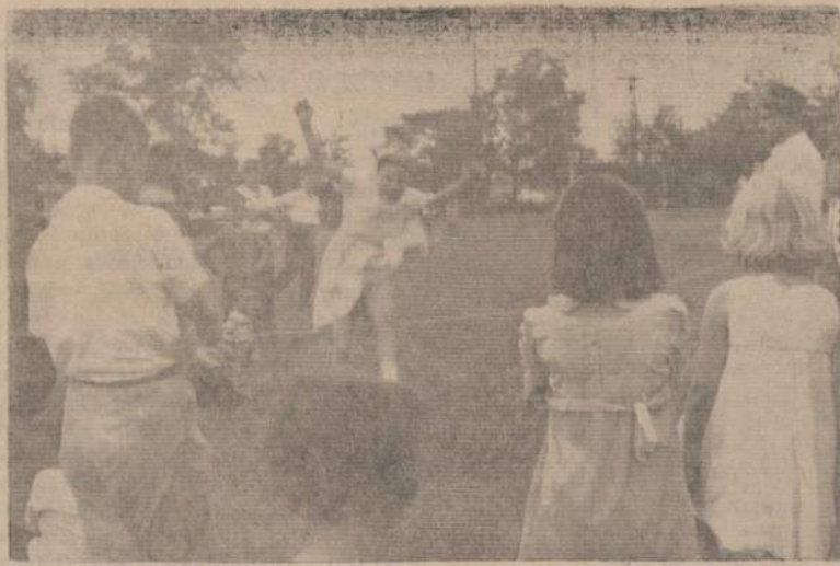
Alvudo suruoštas vaikų užėmimas Naujienų išvykoje labai buvo visų dalyvių atidžiai sekamas. Čia vaikai žoka per virvę.

"Aš nesu prieš protestus, nes protestuotojams niekuomet nebuvo atimta teisė šioje šalyje. Bet protestai turi būti pravedami gero skonio rėmuose. Seniau, protestuotojai savo