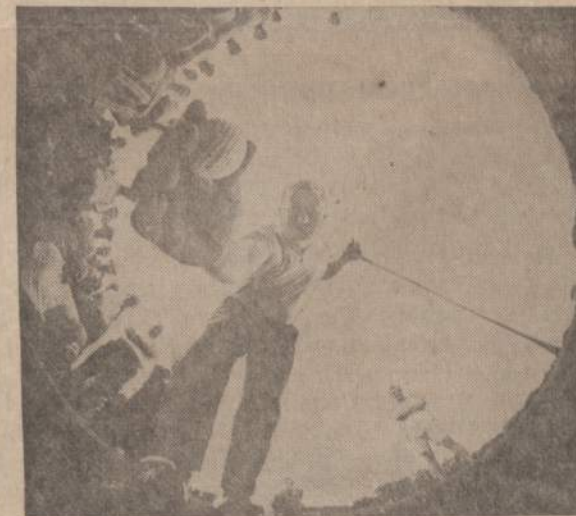
Filadelfijoje golfo lošejas Niklaus nufotografuos iš švedinio duobėles. Sako, kad varžiams pasaulis atrodo taip, kaip jis matomas šioje fotografijoje.