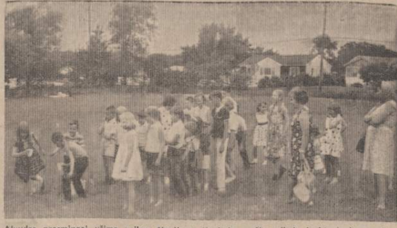
Alvudas prasmingai užima vaikus Naujienų išvykoje — čia vaikai lenktyniauja vandens pilsyme: jie lavina savo raumenis.

Geros rūšies ir gerai prižiū- rima keptuvė tarnaus daug metų. Moteris ir Pasaulis