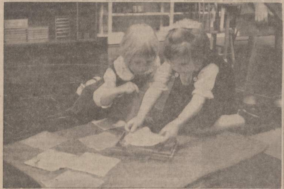
Amerikos Lietuvių Montessori Draugijos Vaikų Nameliuose ant 69-tos gatvės lavinamo save atlieties mokslo dar- bams. Nuotraukoje dvi auklėtinės dirba su spalvotomis skarelėmis — jas lankstant ir dėsant miltelina savo pir- štelius atlieties rašymo darbams.