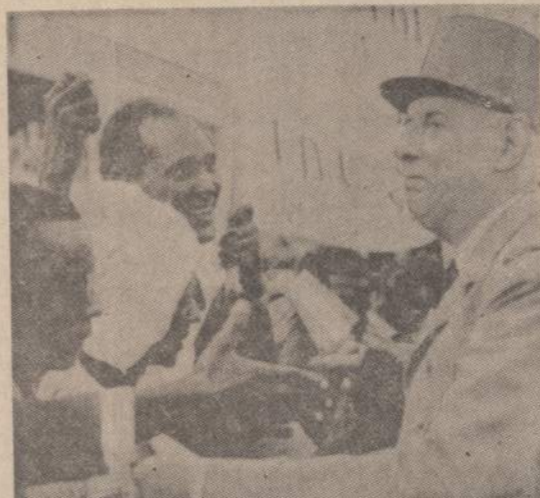
Prezidentas Charles de Gaulle nuskrido į Džibuti, prancūzų So- maliją. Jis rengėsi pasakyti ten ilgą kalbą, bet susirinkusieji tiek triuškavo, kad jis nieko negalėjo pasakyti. Tai buvo ilgos kelionės pirmas nepasisekimas.

Jei tie vadovėlių skaičiai pro- porcingai mokinų skaičiams, tai būtų spręstina, kad lenkų kalba besimokančių moksleivių Lietu- voj dabar yra maždaug 4,5% arba apie 18,000. (E)