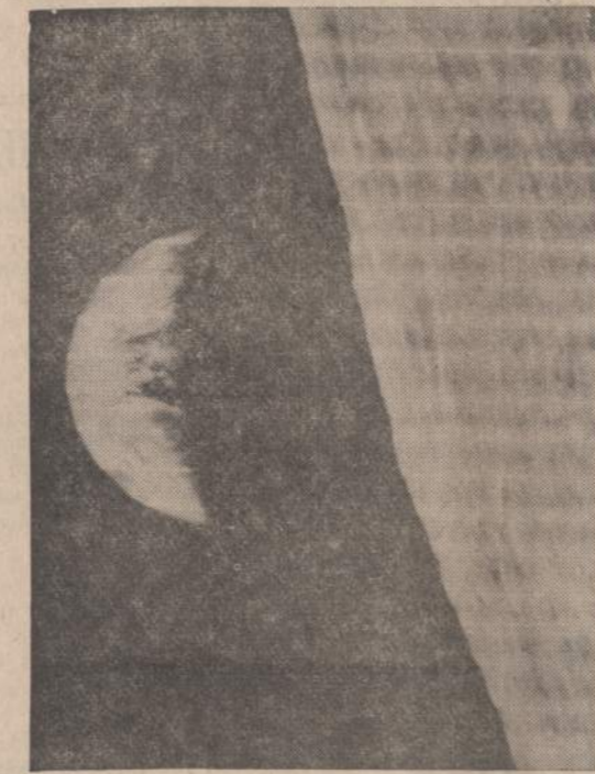
Taip Žemė atrodo iš Mėnulio. Dešinėje matome mėnulio vaizdą, apie kurį sukasi erdvėlaivis su elektroniniu foto aparatu. Kairėje matome Saulės nušviestą šiaurės ir pietų Ameriką. Tai pirmoji Žemės fotografija, traukta iš Mėnulio. Manoma, kad šiomis die- nomis Žemėn bus atsiųsta daugiau josios fotografijų.

ANKARA. — Turkija uždarė savo sieną su Iraku, nes ten siau- ria choleros epidemija. Sirija sieną su Iraku uždarė praėjusią savaitę. Turkija pasiuntė Ira- kui skiepi 200,000 asmenų.