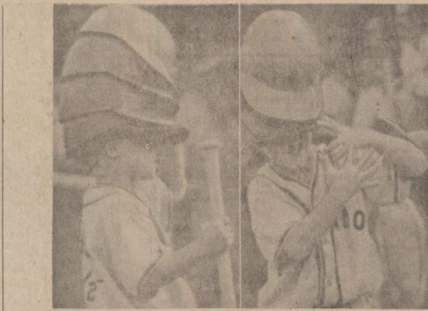
Jau nuolis negalėjo suprasti, kodėl beisbolininko kepurė tokia sunki. Dalykai paaikšėjo, kai pamatė, kad ant jo galvos buvo sukrautos kelios žaidėjų kepurės.

Šitaip savo tautą mylėdami Amerikos lietuviai 1912 m. labai teisingai įvertino lietuvių ir lenkų santykiavimą. Jei kam nepatiktų toks raštas vien dėl to, jog spausdintas "Laisvoje Mintyje", galėtų paieškoti panašių patriotinių raštų ir katalikų spaudoje. "Darbininką" 1938 metais labai pagiria Liet. Šaulių Sąjungos laikraštis "Trimitas" (Nr. 36) už vedamąjį "Darykite kas darytina", pavadindamas tą straipsnį labai protingu. "Darbininkas", kaip "Trimitas" rašoma, plačiai ir teisingai vertindamas peržvelgė lietuvių kovą už Vilnių — už Aušros Vartus. Lietu-