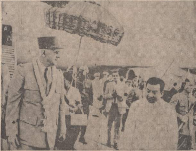
Gen. Charles de Gaulle atskridus į Kambodiją, aerodrome iš pasitiko premjeras Sihanouk (dešinėje) ir keli atsakomingi pareigūnai. Manoma, kad Kambodijoje gen. de Gaulle pasimatys su Vietnamo komunistais.