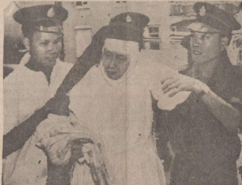
Hongkonga pasiekė 8 senos vienuolės, ilgus metus gyvenusios Pekine. Jos pasakoja, kad psichinėmis dienomis vaikėzai, vadinami "raudonoji gvardija" įsiveržė į vienuolyną, tyčiojosi iš vienuolių, o vėliau valdžia nutarė vienuoles išsiųsti.

Atrodo lyg keista, kad viena didžiausių Londono katastrofų bus paminėta spektakliais, karnavalu, — žodžiu, džiaugsmingai. Tačiau tai pateisinama: didžiojo gaisro pėdsakai jau pranyko. Bet nepranyko po gaisro atstatytas ir atnaujintas Londonas. Todėl ir 300 metų Londono didžiojo gaisro sukaktis minėjimas bus daugiausia susijęs su miesto atstatymu ir atnaujinimu.