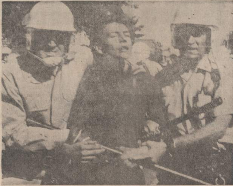
Cicero jaunimas susikirto su atmaršavusiais negrais. Į Cicero negrai suruošė 200 žmonių eiseną. Jie tikėjosi sutraukti apie tūkstantį savanorių, bet prie Cicero miesto sienos atvyko tikiai apie 200 negrų. Juos saugojo Illinoiso nacionalinės gvardijos batalijonas, Cook County serifo policininkai ir Cicero miesto 350 policininkų. Vis dėlto įvyko susirėmimas tarp atmaršavusių negrų ir Cicero jaunuolių. 8 buvo sužeisti, keli durtuvais, ir 38 areštuoti.

Valdybon neišrinkti buvę krikščionys demokratai, bet jų vieton pateko frontininkų veikėjai.