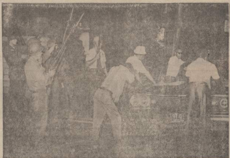
Ohio gubernatorius pasiuntė į Daytoną nacionalinės gvardijos karių, kad patėtų policijai nunginkuoti riaušius ir atstatyti tvarką.

Iš v a d a: Supraskime odos ir viso kūno sveikatos dėsnius, tada mums bus lengviau viso kūno sveikatą užlaikyti. Tiek vyras, tiek moteris gali sveikai atrodyti ir pakankamai tvirtos sveikatos senyvam amžiuje būti, reikia tik niekada ir niekame neperdėti. Saikingas gyvenimas nuo pat jaunystės yra geriausias