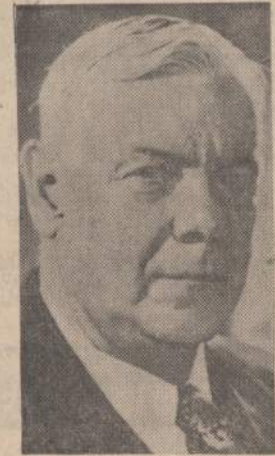
Pietų Afrikos premjeras Hendrik Verwoerd, parlamente nužudytas rugsėjo 6 diena. Pradžioje paskelbta, kad jį nužudė parlamento pasiuntinys, bet vėliau pasisiekė, kad jį nužudė pasiuntiniu persirengęs Dimitrio Tsafendas, iš Mozambiko atvykęs graikų ir portugalų kilmės jaunuolis. Tsafendas buvo nepatenkintas Verwoerdo vedama rasine politika.

DAMASKAS. — Sirijos baath partija paskelbė, kad buvo išaiškintas naujas smokslas nuverst- 6 mėnesių vyriausybė.