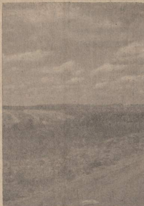
KARBERIO KALVOS - CARBERRY HILLS

Jeigu nori sužinoti naujais ir tikriausias žinias, kas dedasi pasaulyje ir okupuotoje Lietuvoje — skaityk dienraštį "Naujienas".