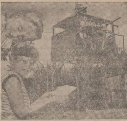
Forth Worth, Tex., vaikai, neturėdami medžių, kur galėtų žiūri ir pasidaryti, pasistatė pavėksle matomą dviaukštę būdą. Bet kaimynai pasiskundė, kad vaikai žiūrėję į apverttą ju kiemą, o miesto vadovybė įsakė būdą nugriauti, nes jį pastatyta be miesto leidimo.

— Po įvadinį pastabų seka Grožinio skaitymo mokymo tikslas: — mokymo planingumas, Dėstymo sistema; — metodas ir — forma. Toliau seka keturios pilnos grožinio skaitymo pamokos. Baigiamosios pastabos: Sistemingo dėstymo