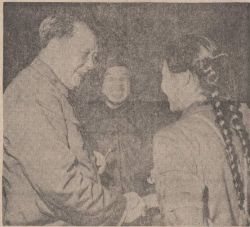
Maocektungas sveikina Raudonosios Gvardijos narius, pravedusius "kultūrinę revoliuciją" miestuose. Jis patarė jiems tą "revoliuciją" prarasti ir provincijoje, bet nenori, kad būtų sutrukdyti žemės ūkio darbai.

Apie premjero Verwoerdo žudiką ateina vis daugiau žinių. Portugalijos kolonijoje Mozambike pranešama, kad Tsafendas net tris kart buvo sulauktytas portugalų saugumo policijos. Vienu atveju pas jį buvo rasti net penki pasai ir nemaža suma pinigų. Iš Izraelio pranešama, kad Tsafendas 1961 metais bandė įvažiuoti į Izraelį, tačiau nebuvo įleistas.