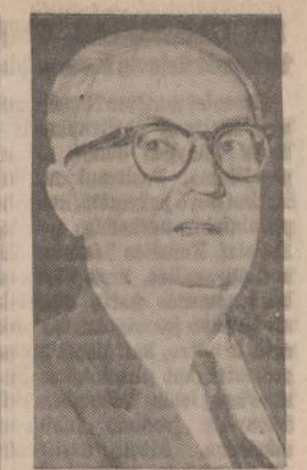
Kongreso atstovas Wright Patman yra pasiryžęs kovoti prieš infliaciją, bet nepatenkintas prezidento Johnsono priemonėmis. Prezidentas mano, kad geriausias būdas kovoti prieš infliaciją, tai pakelti korporacijų taksus, o Texas atstovas Patman nori sumažinti nuomščius paskoloms.