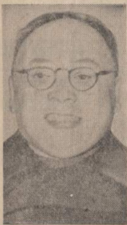
Kinijos užsienio ministeris Chen Yi pareiškė, kad komunistinė Kinija nenori karo su JAV ir ji neaiškina minėtis, kad pasitarimai Vietnamo karo reikalais tarp Washingtono ir Pekino galėtų būti naudingi.