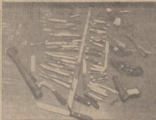
NEPILNAMEČIŲ PIKTADARIŲ ARSENALAS

Wilsonas turėjo tiesą, čikagiečiai pasirodė jautresni ir sąmoningesni piliečiai. Šiandien, po pustrėčių metų nuo "Crime-Stop" įvedimo, jau daugiau kaip 750,000 čikagiečių dalyvauja šiame pilietinės sargybos žygyje, tai yra įsikaulė galvon, užsirašė telefonu adresu knygoje pirmoje vietoje, užsirašė į kišeninę knygelę, įsidėjo į rankinuką ar piniginę tuos du žodžius, dvi raidės ir 5 skaitlines "Crime-Stop — PO 5-1313", kad savo ar artimo bėdos atveju galėtų paskambinti kur reikia; organizuotai į Crime-Stop isto-