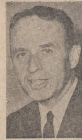
New Yorko demokratai pasirinko New Yorko miesto tarybos pirmininką Frank O'Connor kandidatui į valstijos gubernatorių. Jam bus sunku įveikti gub. Nelson Rockefeller. Didelė klūpinti jam bus Franklin D. Roosevelt Jr. nutarimas kandidatuoti į gubernatorių liberalų partijos vardu.

Esanti tik viena maisto parduotuvė ir vienas paviljonas, kuriame parduoda tik alų, degtinę ir kiek šaltų užkandžių ("girtuokliams pirmenybė"). Nėra pirties, o kirpėjas užsuka tik kartą per dvi savaites. (E)