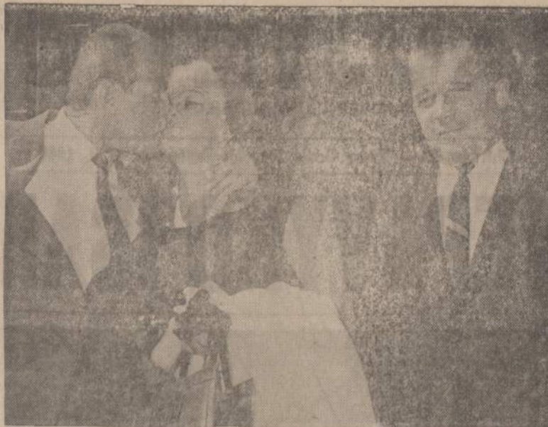
Už pirmos žmonos nužudymą nuteistas, bet antrą bylos svarstymą išsikovojo Dr. Sam Sheppard, išėjęs iš teismo salės, bučiuoja naują savo žmogą. Dešinėje stovi gabus jo advokatas Lee Bailey.