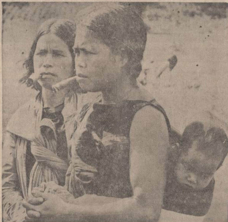
Pietų Vietname, netoli Kambodijos sienos, prie Pleiku miestelio, dvi vietnamietės, rūkydamos cigaras, klausosi kandidato į seimą kalbos. Neatrodo, kad tas kandidatas būtų joms viską pakankamai išaiškinęs.

Vilniškė valdžia nutarė, pradėdant 1967 metais, perstatyti Vilniaus, Kauno, Klaipėdos ir Kėdainių senamiesčių kai kurias dalis pagal suderintus su Kultūros ministerija ty senamiesčių restauravimo projektus. Išsaugant architektūrinio bei meninio požiūriu vertingus pastatus, būsią pagerintos sanitarinės — buitinės sąlygos: sutvarkyti kiemai, aikštelės, ir įvesta kanalizacija, vandentiekis, elektra, dujos, karšto vandens tiekimas. Tas viltingas pažadas džiugina ir kartu liudija, kokio padėty tie senamiesčiai yra dabar. (E)