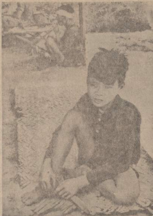
Keturiolikos metų berniukas prižadėjo nuvesti JAV marinius ir komunistų oia, bet jis juos įvedė į minomis išklotą lauką. Keli Amerikos mariniai buvo sunkiai sužeisti. Tarymas parodė, kad jis sąmoningai melavo amerikiečiams. Dabar jis tordomas. Norima išaiškinti, su kuo jis bendradarbiavo.

Tai vis priežastys, davusios Susivienijimui pradžią, o ta pradžia atsivėrė vos tik 23 metams prailkus nuo galutinai panaikintos baudžiavos steigėjų senojėje tėvynėje Lietuvoje (Caro manifestas paskelbtas 1861 m. vasario 19 d., bet dar pridėta 2 metai ligi galutinio baudžiavos likvidavimo), arba tik 44 metams prailkus nuo Lietuvoje paskelbto įstatymo, draudžiančio pardavi-