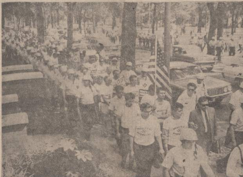
Amerikos nacių vadas George Lincoln Rockwell Chicagoje buvo suimtas ir patrauktas atsakomybėn. Prieš kelias savaites Chicagoje jis sušaukė savo šalininkų susirinkimą bei leidimo. Tame pačiame susirinkime jis rinko pinigus savo partijai, bet ir šitokiame darbu jis nebuvo gavęs reikalingo miesto leidimo. Policija pralaukė Rockwell 8 valandas, kol jis surinko reikalingus pinigus užstatui. Tuo tarpu nacių šalininkai maršavo pietinėje Chicagoje.