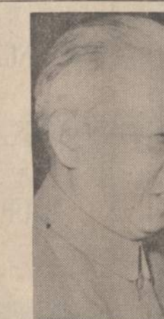
Komunistinės Kinijos prezidentas Liu Šaoč'is buvo kompartijos vicepirmininku. Vicepirmininku buvo ir premjeras Ču Enlaj. Jiems atimti vicepirmininkų titulus. Paliktas tik vienas vicepirmininkas — karinio ministras gen. Lin. Manoma, kad Mao Četungas planuoja jį palikti valstybės priešaikių.

Pasaulio rinkoje džiaugsmingai buvo sutikta žinia, kad rugpjūčio mėn. britų eksportai smarkiai viršijo importus.