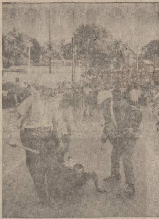
Paveiksle matome policininkus, Atlanta, Ga., mieste suėmusius riaušinininką. Policijai pavyko riaušius apraminti, bet mieste nuolatikos dar labai pakilusios.

"NAUJENOS" KIEKVIENO DARBO ŽMOGAUS DRAUGAS IR BIČIULIS