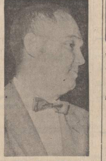
Respublikonas Thomas B. Curtis reikalauja, kad krašto gyventojams būtų duota proga pasisakyti Vietnamo karo klausimu. Jis kritikuoja prezidentą Johnsoną.

BALZEKAS MOTOR SALES "U WILL LIKE US" CHRYSLER • IMPERIAL PLYMOUTH • VALIANT 4030 Archer — VI 7-1515