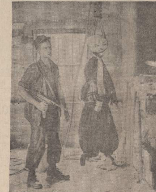
Amerikos marinai išmušė komunistus iš Da Nang srityje esančio kaimelio. Marinas naudoja iš komunistų atimta gera automatinių šautuvų. Komunistai paliko pakartą iškamšą, gaudindami žmones, kad ir jie bus pakarti, jeigu bendradarbiaus su amerikiečiais.

TEL AVIVAS. — Netoli Mados miesto arabų teroristai nukirto Izraelio vandens vamzdį. Izraelio vyriausybė pasiskundė JT paliaubų komisijai.