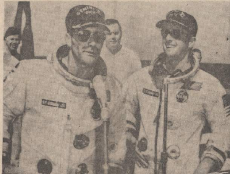
Astronautai Peter Conrad ir Richard Gordon, išlipę iš helikopterio "Guam" laivo denin, sveikina iš vandens juos iškėlusią įgulą.

— Kaikurios įmonės Lietuvoj, rusų valdžiai leidus, pradeda dirbti po penkis dienas savaitę (8 darbo valandas kasdien).