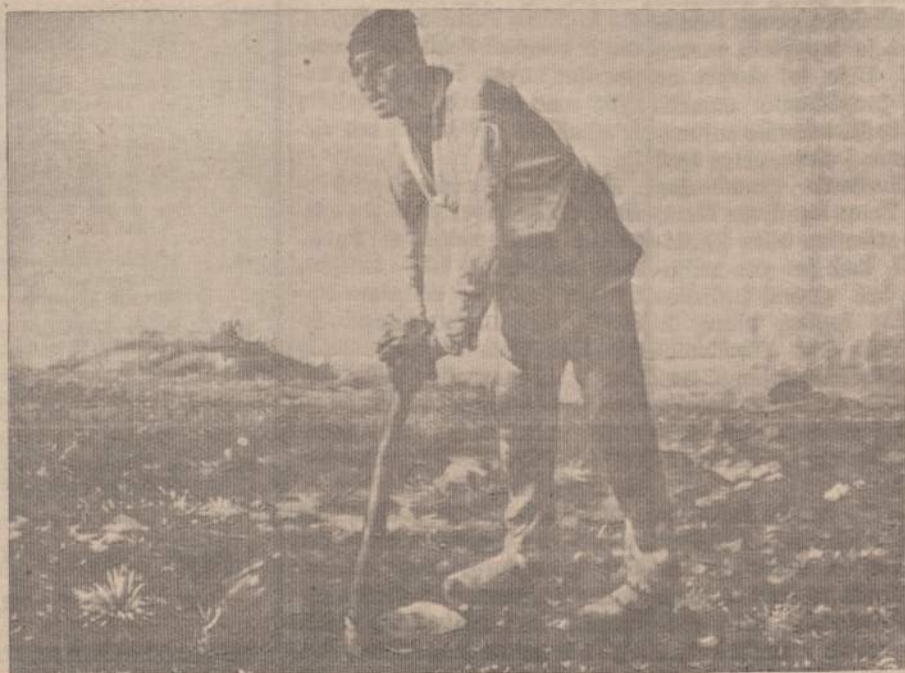
JEAN FRANCOIS MILLET