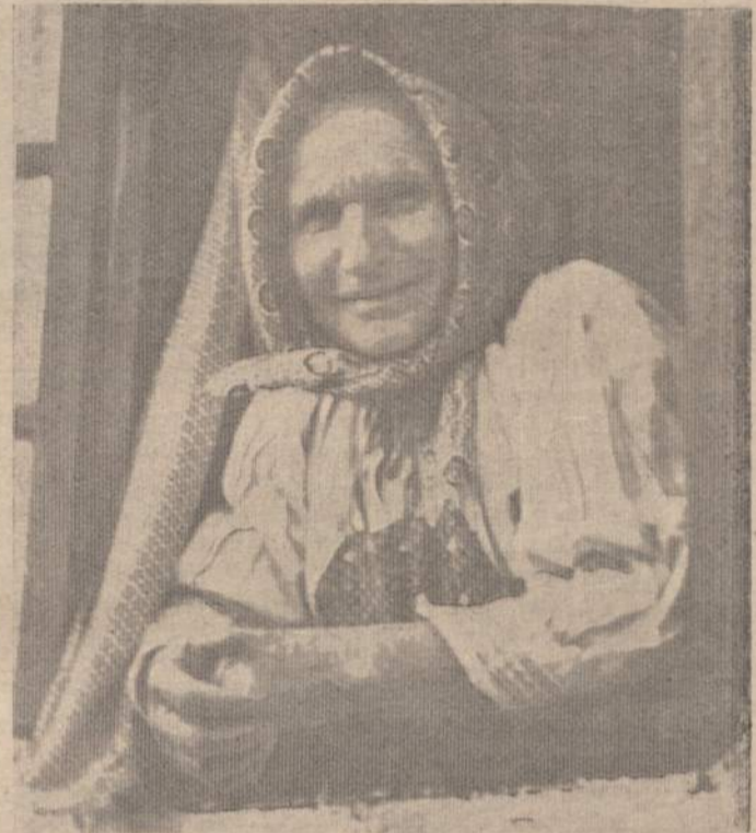
MOTERIS ŽIŪRI PRO LANGA