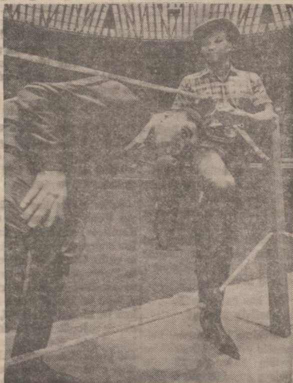
Lapkričio 14 diena stipruolis Cleveland Williams boksuosis su sunkaus svorio čempionu Cassius Clay. Paveiksle Williams parodė sunkaus svorio čempionui Houston salę ir pakėlė virvę, kad galėtų įeiti į areną. Williams pasakė, kad rungtynių metu jis nebus toks mandagus su Cassius Clay.