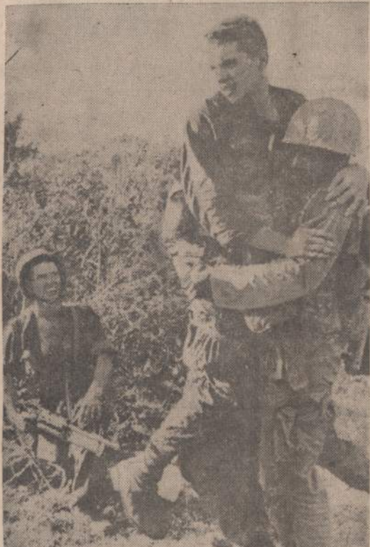
Šiaurės Vietname buvo sužeistas JAV marinas. Sanitarinio korpuso karys neša sužeistąjį į užfrontą, kad galėtų suteikti jam pirmąją pagalbą.

Klaipėdoje įtaisyti rusų žvejybos laivynas šiuo metu gauda silkes Grenlandijos jūroje, į šiaurės rytus nuo Jan Mayo salos (apie pusantro tūkstančio mylių tiesiai į šiaurę nuo Londono). Žvejyja apie 70 laivų. Kasdien, esą, sugauna iki 490 tonų silkių, kurias perduoda tiesiai į rusų laivą (ne iš Klaipėdos). Laive silkės sūdomos ir net sudedamos į skardinėles. Silkėms neteks Klaipėdoj nė "paviešėti". (E)