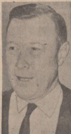
Automobilių unijos pirmininkas Walter Reuther prašo kongresą, kad būtų ištaisyti automobilių kainos tokios didelės. Jis mano, kad didelės kainos yra skandalingos, jos galėtų būti žymiai mažesnės.

Vienuolika vadovaujančių Vilniaus architektų ir kultūrininkų paskelbė griežtą protestą prieš ryšį (pašto, telegrafo, telefono) ministerijos užsimojimą statyti keturių aukštų priestatą (telegrafo reikalams) Stukos (Gucevičiaus gatvėje, ties Bonifratrų bažnyčia ir Gedimino (Katedros) aikštė. Ta proga aštriai kritikuoja visą tos maskvinės ministerijos šeimininkavimą Vilniuje — savotišką ekonomiją "siuvant švarką prie sagos" ir nesiskaitant su miesto stilium išlaikymo reikalavimais. (E)