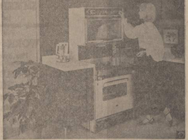
COOKING CENTER — The Hotpoint Hi/Low Hallmark range gives the homemaker double-oven convenience in one compact unit. Smokeless surface cooking and closed-door broiling are possible with its unique built-in ventilation system.