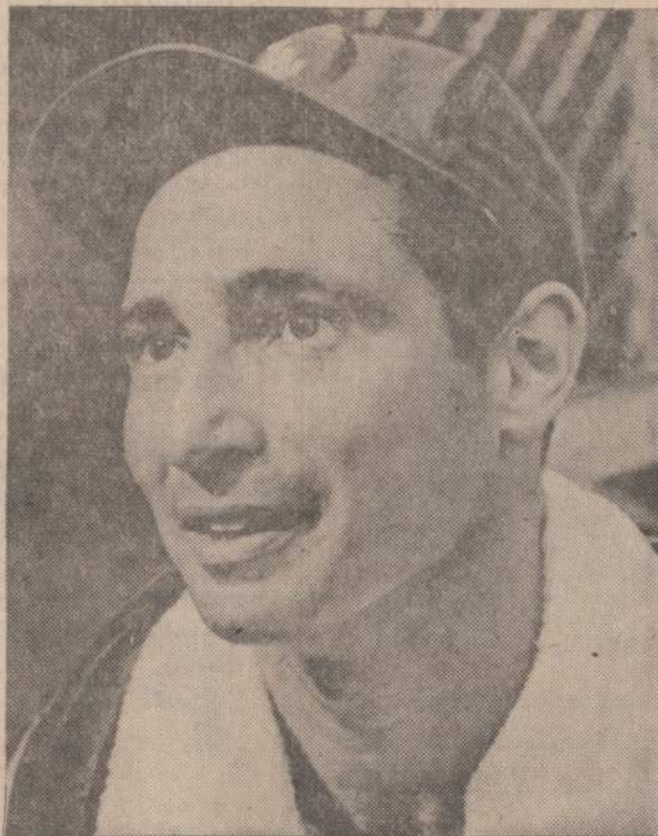
Los Angeles Dodgers beisbolininkų kamuolio sviedėjas Sandy Koufax.