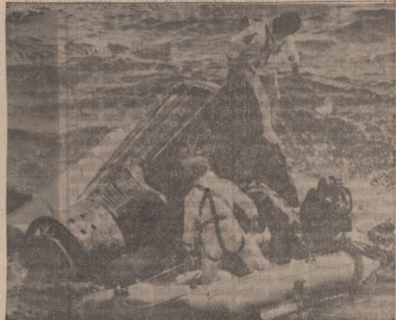
Amerikos astronautai Peter Conrad ir Richard Gordon rugsėjo 15 dieną nusileido tikrai trijų mylių atstumu nuo ju laukusio iektuvnešo "Guam". Paveikslė matome astronautą Conrad jau stovintį helikopterio numestame plauste, o astronautą Gordoną, lipantį iš erdvėlaivio. Tris dienas praleikioje erdvėje, įjedu laimingai nusileido ir buvo nusikristinti į laivą.

6) Taut. Fondacijos veikimo normos ir taisyklės turi būti išdėstytos atskirame statute, kurį išdirbs Taut. Fondacijos Globėjai, SLA Pildomajai Tarybai pritariant. Bet jau šiandien mes turim su prasti, kad bus remiama lietuvių kultūrinė veikla, Lietuvos laisvinimo kovos ir ypatingai bus palaikomas lietuvių jaunimas, kad stiprėtų tautinėje dvasioje ir galėtų pasireikšti intelektualinėje kultūroje.