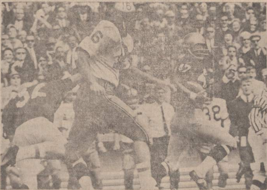
Notre Dame sportininkai sumušė Purdue jaunuolius 26-14. Paveiksle žymesnieji sportininkai kalbasi apie praleimtą žaidimą.