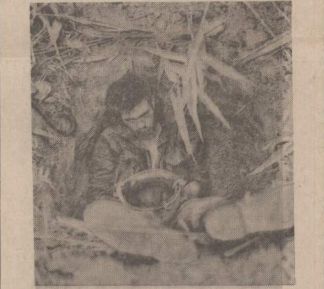
Pietų Vietname, Dong Ha srityje, Amerikos marinams teko vesti sunkios kovos su komunistais. Aprimus kovoms, gerokai išvargę marinai išsis.

Washingtonė manoma, kad JAV išlaidos nesumažėtų, net jeigu karas Vietname ūmai sustotų. Bet dalis išlaidų būtų skiriama kitiems reikalams.