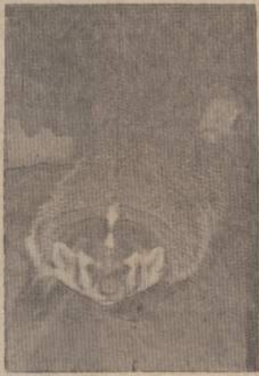
Meles taxus arba Meles vulgaris arba amerikoniškas barsukas.

— Ei! šūkerėjau visai arti priėjęs ir švedžiau rankose turėdą brūklį, kurs nepataikė, bet tą sutvėrimą sudimono! Pirmą atsuko į mane galva ir pažūrėjo su nemažesniu nustebimu, kaip aš į jį. Mano tikrumas, kad ims bėgti, net užkulniai į uodegą mušis, pasirodė buvęs klaidingas. Sutvėrimas staiga atsisuko į mane ir išsitiesęs visu savo kūnu prisiploktino prie žemės. Dabar jis labiau atrodė artimesnis vilkui ar meškai negu podirvio kiauilytei ar kanadiškam ežiui! Atsisuko tiesiai priešais, pasidėję ant žemės savo juodomis ir baltomis driūžėmis, lyg indeno kareivos, išdažytą veidą ir į mane akis įbedęs truputį vyperėjo,