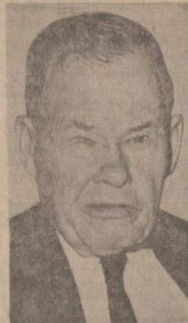
Gen. Louis B. Puller Los Angeles, Cal., mieste pareiškė, kad Vietnamo karas nieku nesiskiria nuo anksčiau buvusių karų. Amerikos kariuomenė turi sulaukinti prieš ir grįžti namo. Gen. Puller vadovavo JAV marinams.