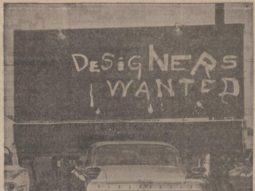
Didelė Indianapolio bendrovė pastatė šią iškabą. Iš iškabos aiškiai matyti, kad bendrovei reikia lingi braižytojai.