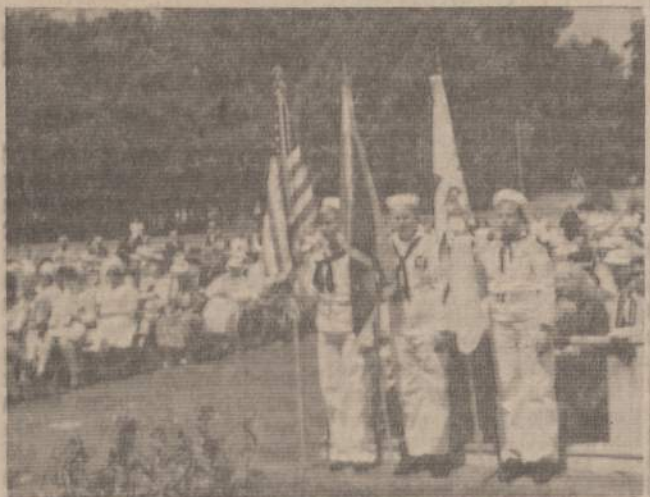
Lietuvių Bostono Jūrų skautijos vėlavos lauko pamaldų metu stovyklaujant.

Taupymo mėnesio proga lietuviui kveičiamai atsilankyti į savas bendroves, arčiau susipažinti su jų veikimu, o dar geriau — atidaryti naują taupymo sąskaitą. Kas šiandien taupo, padeda ne tik sau, bet ir visam kraštui.