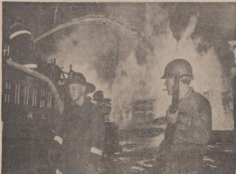
Milžiniškas gaisras San Francisco medžio statybinės medžiagos sandėlyje, esančiame toje vietoje, kur vyko rasinės riaušės. Nacionalinės gvardijos kariai suteikia apsaugą gaisrininkams, į kuriuos buvo paleisti keli šūviai.

nio vandens atsargų Lietuvoj esą apie pustrėčio milijono kubinių metrų (apie 660 milijonų galonų) per parą. Todėl vandens bėdas Lietuvai negresia, bet taupymo ir tvarkos reikia. (E)