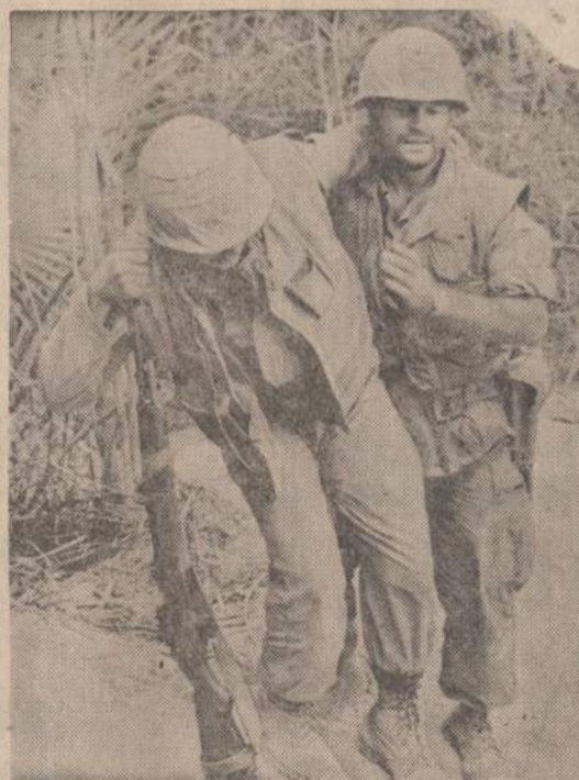
Draugo prilaikomas, sužeistas Amerikos karys, pasiremamas šautuvu žygiuoja iš Vietnamo karo fronto.

◆ Senatorius Douglas ir respublikonų kandidatas į senatą Percy vėl pradėjo priešrinkiminę kampaniją.