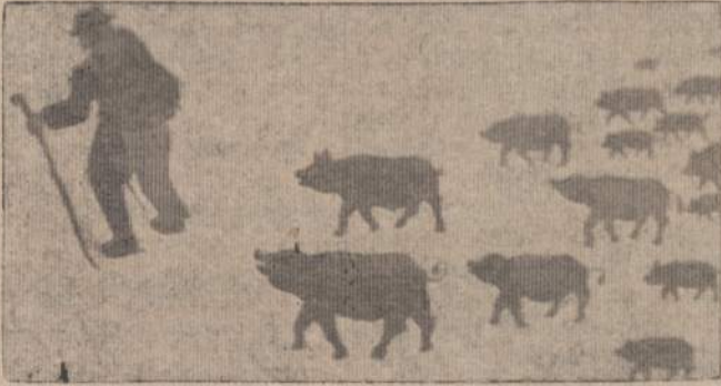
Grįžimas iš urvinio žmogaus gadinės i civilizaciją...

Iš urvinio žmogaus gadinės i civilizaciją ... kelias pilnas pavojų