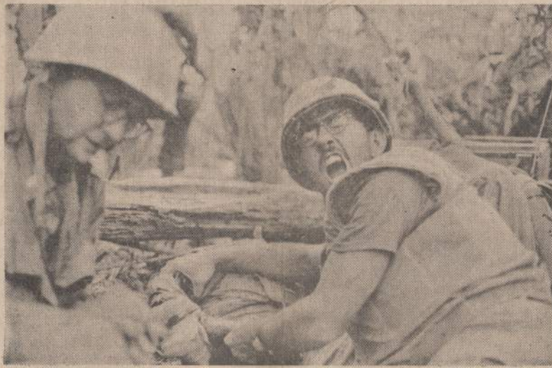
Praeitą savaitę šiaurės Vietname ėjo smarkios kovos su atsišais komunistais. Paveiksle matome JAV marina, šaukiantį pagalbos sužeistam draugui. Pirmoji pagalba buvo suteikta pačioje pafrontėje, o vėliau jis helikopteriais nuneštas į ligoninę.

Ambasadorius Thompsonas esąs labai ramus, kantrus ir užsispyręs vyras. Jis neblogai išmoko rusiškai ir gerai sugyvendavo su buvusiu premjeru Chruščiovu. Maskvos ambasadoriumi jis jau išbuvo devynis metus. Per tą laiką nepasitaikė didesnių susikirtimų tarp abiejų kraštų. Kada 1960 metais sovietai numušė Amerikos U-2 šnipinėjimo lėktuvą, Chruščiovas kaltino prezidentą Eisenhowerį ir kitus pareigūnus, bet Thompsonas ir toliau likęs jo geru prieteliu. Didelį darbą ambasadorius Thompsonas atliko besiderėdamas su sovietais dėl Austrijos taikos sutarties. Buvo net 380 oficialūs susitikimai, kol 1955 buvo pagaliau susitarta.