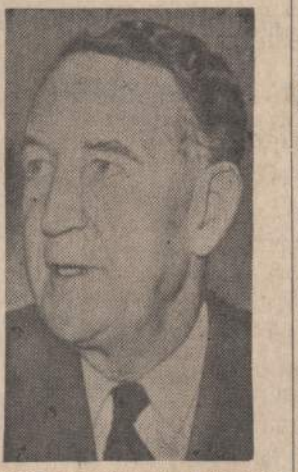
Užsienio departamento tarnautojas Lewellyn Thompson pasikirtas JAV ambasadorium Maskvoje. Jis devynis metus praleido sovietų sostinėje ir gana gerai pažįsta komunistus ir jų valdymo metodus.

RIO DE JANEIRO. — Brazilijoje pragyvenimas praėjusių mėnesį vėl pabrango 2, 3 nuosimčiais, pakeldamas šių metų pakilimą iki 35.2%. Vyriausybė kainų kilimą pavyko truputį pristabdyti, nes per praėjusius metus kainos pakilo 45%. Pernai už dolerį buvo mokama 1,850 kruizerų, o šiuo metu — 2,200 kruizerų.