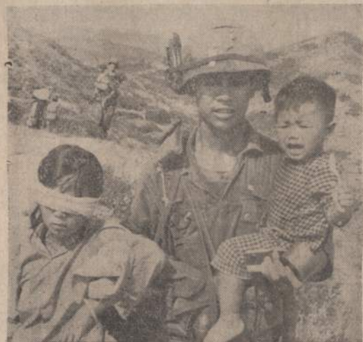
Amerikietis kareivis Pietų Vietname neša iš mūšių lauko du išsigančius vietnamiečius. Kaip kiekviename kare, taip ir šitame daug nukentėta civiliniai gyventojai ir nekalti vaikai.

MANILA. — Filipinuose sprogdus fajerverkams žuvo 14 asmenų, jų tarpe 10 vaikų.