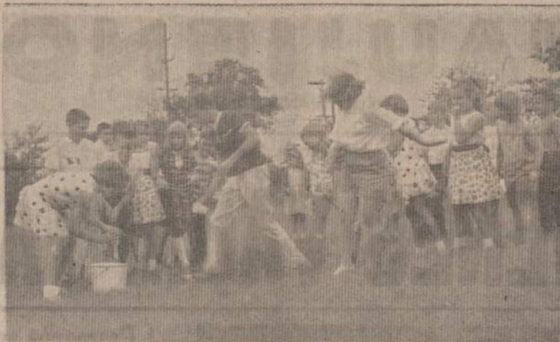
Stenkimės kitos eilės vandens pylejus praleisti visi vikriai ir teisingai žaisdami... vaikai lavinasi Alvudo Išvykoje gamton, vadovaujami patyrusių sportininkų.

Baigdamas noriu pabaidyti jaunas moteris, o ypač motinas.