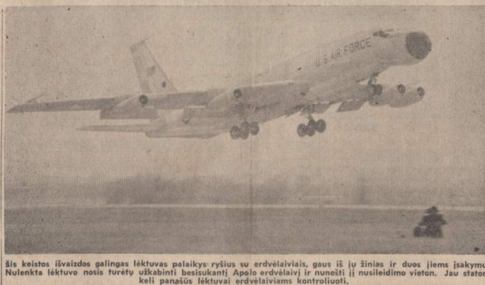
Šis keistos išvaizdos galingas lėktuvas palaikys ryšius su erdvėlaiviais, gaus iš jų žinias ir duos jiems įsakymus. Nulenktu lėktuvo nosis turėtų užkabinti besisukančią Apolo erdvėlaivį ir nunešti jį nusileidimo vieton. Jau statomi keli panašūs lėktuvai erdvėlaiviams kontroliuoti.

Galima, o Europai pačiai reikia rūpintis savo interesais ir savo saugumui.