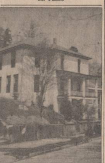
PARDUODAMAS paveiksle matomas 18 kambarių nuomavimo namas (rooming house). Taksai tik $120, o mėnesinės pajamos — $500.00. Pardavimo priežastis — mirtis šeimoje. Imokėjus sutartą dalį, likusią sumą leisiu mokėti po $100 į mėnesį.

BUS ĮVESTA VISO 51,000 LEMPU. Darba, atlieka paties miesto Gatvių ir Sanitacijos biuras su savo darbininkais, sutauptant $500,000, nes privačios firmos pačiu pigiausiu pasiūlymu reikalavo pusės milijono dolerių daugiau negu kaštus miestui pačiams atliekant darbą. BALZEKAS MOTOR SALES "U WILL LIKE US" CHRYSLER • IMPERIAL PLYMOUTH • VALIANT 1030 Archer — VI 7-1515