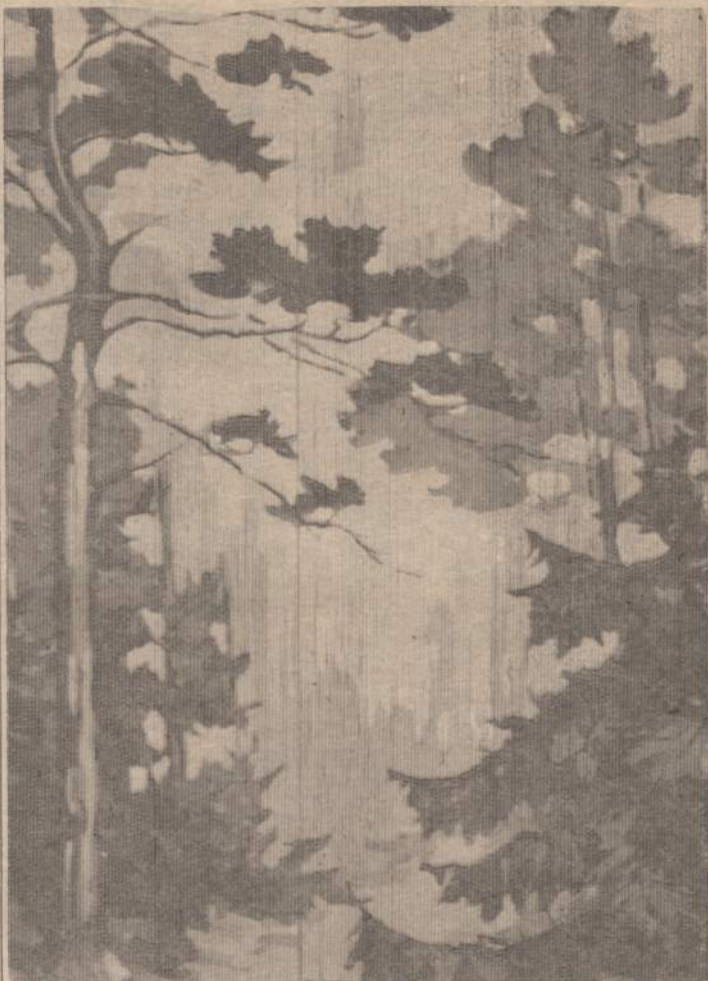
RYTAS PARKE, PALANGA

Silikono išvirkštimai po oda raukšlėms išlyginti, natūrali-nėms formoms papildyti, krū-tims padidinti jau plačiu ma-štu išbandomi ir kai bus FDA (Maisto ir Vaistų Administraci-jos) leisti, turės milžinišką pa-reikalavimą, taigi suteiks didelį naujų uždarbių šaltinį. Heidel-berge, Vokietijoje, jau išbando-ma 3 sluoksnių dirbtinė oda, pa-vyzdžiui nudegus, bet kol kas kūnas po maždaug 40 dienų ją atmeta.