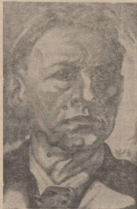
BALYS SRUOGA (Tapyba)