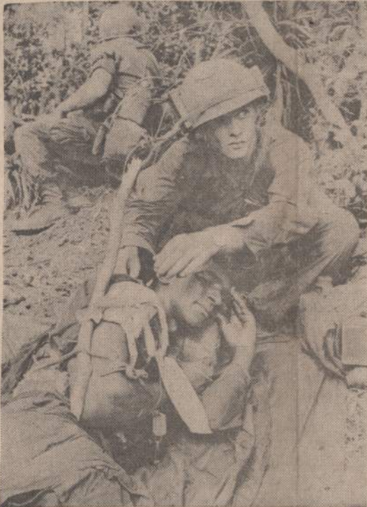
Pietų Vietname mūsų metu buvo sužeistas vienas Amerikos karys. Jo draugas, suteikęs pirmąją pagalbą, saugo sužeistąjį, kol jis bus nugabentas į užfonę, o vėliau į ligoninę.

...kia mada". Todėl per laikraštį uoliai aiškina, kad ta mada esanti bloga. (E)