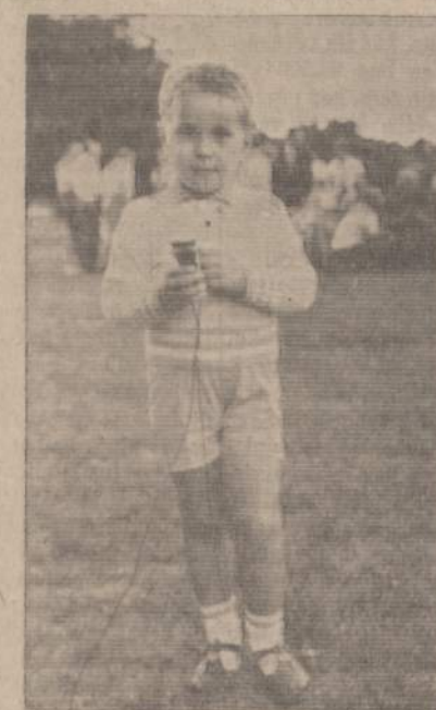
Alvudo Vaikų Teatro aktorius pratina si Kultiūriame šėštadienyje.