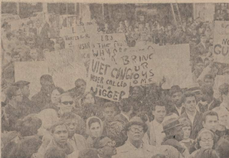
Kai prezidentas Johnson atvažiavo į Brooklyną, kad padėtų demokratų partijos kandidatams rinkiminėje kampanijoje, tai jis buvo sutiktas su pavelskite matomais plakatais. Grupė komunistuojančių reikalauja, kad atšauktų Amerikos karo jėgas iš Vietnamo ir įleistų komunistams užvaldyti tą kraštą.

Vienuose tokiuose spąstuose pagavau prerijų vilką. Jį brūkliai užmušęs ir numetęs į pašalį, prarij Karberio kalvose tuomet tais laikais labai daug buvo. Iš jų Bingo išmoko slapta užsigar-