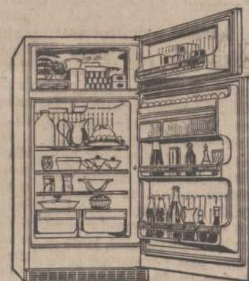
HOTPOINT MODEL CTF114G Hotpoint No-Frost 13.8 cu. ft. 2-Door Combination. This unit features a 10.8 cu. ft. No-Frost refrigerator with a separate 10.2-lb. No-Frost freezer. Roomy, full-width shelves, twin vegetable crispers. Rolls out on wheels.