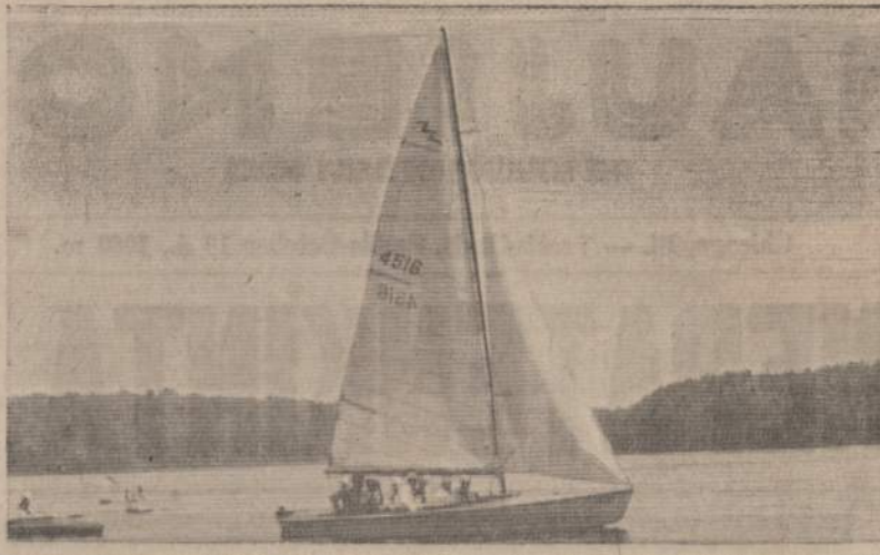
Chicagos "Lituanicos" tunto jūrų skautų burlaivis "Vėtra" Rako stovyklavietės ežere. "Vėtra" lydi dvi LSS Juodkrantės jūrų skautėlių tunto baidarės.