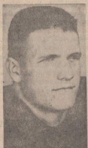
Aukščiausias teismas patvirtino žemesnio teismo sprendimą, kuris draudžia Houston, Tex., sportininkui Neely žaisti.

Illinojaus valst. sekretorius praneša, kad kelevinių automobilių leidimų lenteles (license plates) nuo gruodžio 1