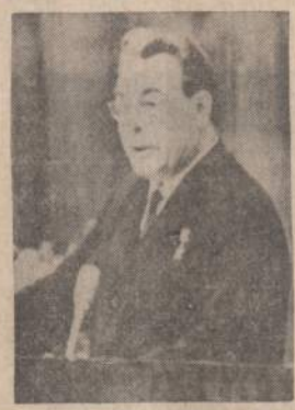
Rusijos komunistų partijos sekretorius Leonidas I. Brežnevas į Kremlių atvažiavusiems lenkų komunistų atstovams pasišėkė, kad negalima laukti geresnių JAV ir Sovietų santykių, kol nebūs baigtas Vietnamo karas.

◆ Amerikos lėktuvai vėl pradėjo bombarduoti demilitarizuotą zoną tarp Šiaurės ir Pietų Vietnamo. Komunistai iš tos zonos savo kariuomenės neatitraukė, nors amerikiečiai buvo kelioms savaitėms pertraukę lėktuvų puolimus.