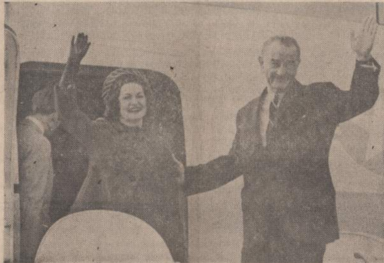
Prezidentas Johnsonas su savo žmona pirmadienį iškrido į Pietų Azijos valstybes. Antradienio rytą buvo gražiai sutiktas Havajuose. Paveiksle matome prezidentą Johnsoną su žmona, Washingtono, lipančius į lėktuvą.

WELLINGTONAS. — Šiandien prezidentas Johnsonas atvyksta į Naująją Zelandiją. Vyriausybė ir gyventojai pasitiko svečius labai šilta, tačiau pasitaikė ir demonstracijų prieš karą Vietname. Prezidento lėktuvas turėjo nusileisti Ohakea aviacijos bazėje, 100 mylių nuo Wellingtono, nes čia nėra tokio aerodromo, kuriame galėtų nusileisti didieji, ilgų takų reikalingi lėktuvai. Wellingtone trūksta viešbučių, todėl visi korespondentai bus apgyvendinti sename laivame "Hinemoa", kuris stovi uoste. Prezidentas su ponia bus britų generalinio gubernatoriaus Sir Bernardo Fergusono svečiai.