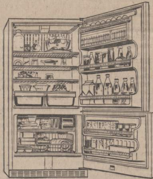
HOTPOINT MODEL CBF115G Spacious Hotpoint 14.9 cu. ft. 2-Door Combination. Has 10.8 cu. ft. No-Frost refrigerator and 14.4-lb. No-Frost freezer with lift-out basket and two door shelves. Slide-out shelves, twin vegetable crispers, dairy storage and deep door shelves are featured in refrigerator, rolls out on wheels.