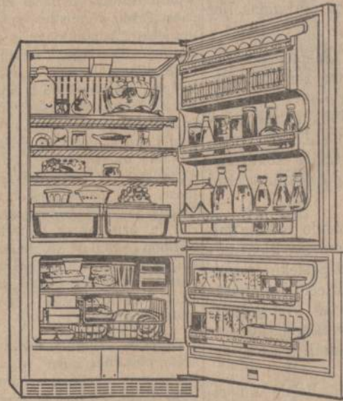
Spacious Hotpoint 14.9 cu. ft. 2-Door Combination. Has 10.8 cu. ft. No-Frost refrigerator and 144-lb. No-Frost freezer with lift-out basket and two door shelves. Slide-out shelves, twin vegetable crispers, dairy storage and deep door shelves are featured in refrigerator, rolls out on wheels.