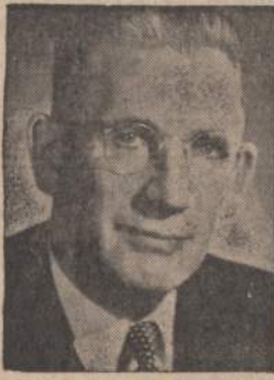
Sen. Paul. H. Douglas

I tą klausimą atsakys Illinojaus žmonės, bet senatorius Douglas nori padėti išsiaiškinti