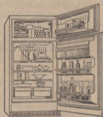
HOTPOINT MODEL CTF114G Hotpoint No-Frost 13.8 cu. ft. 2-Door Combination. This unit features a 10.8 cu. ft. No-Frost refrigerator with a separate 102.9-lb. No-Frost freezer. Roomy, full-width shelves, twin vegetable crispers. Rolls out on wheels.