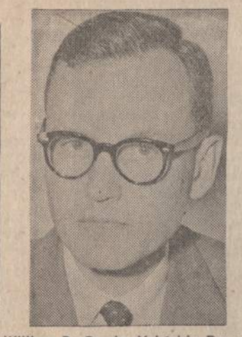
William P. Bundy, Valstybės Departamento Tolimųjų Rytų ekspertas, dalyvauja Manilos konferencijoje.

Praeitį penktadienį atstovų rūmai (House) Washingtono 204 balsais prieš 141 priėmė įstatymą, kuriuo pagaliau įsteigiamas Michigano paežerės nacionalinis parkas Indianoje.