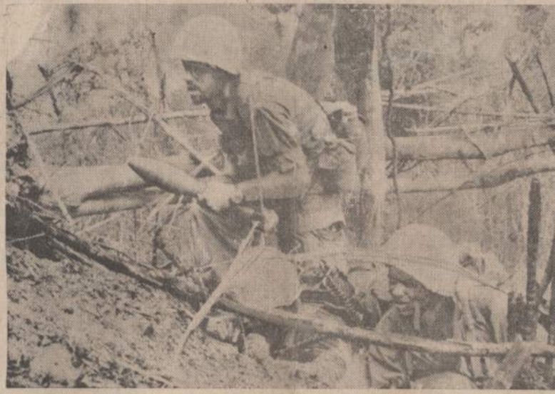
Vietname JAV marinas, raketa rankoje, skuba prie komunistų laikomo apkasos, kad galėtų paleisti į jį raketa. Kovos vyksta šiaurės Vietnamo pasienyje.