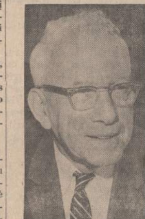
Senatorius George Aiken siūlo dabar paskelbti, kad JAV laimėjo karą Vietnamo. Jam atrodo, kad tada būtų daug lengviau susikabinti su komunistais, šiandien kiekvienam jau aišku, kad komunistai Pietų Vietnamo nepavergs.