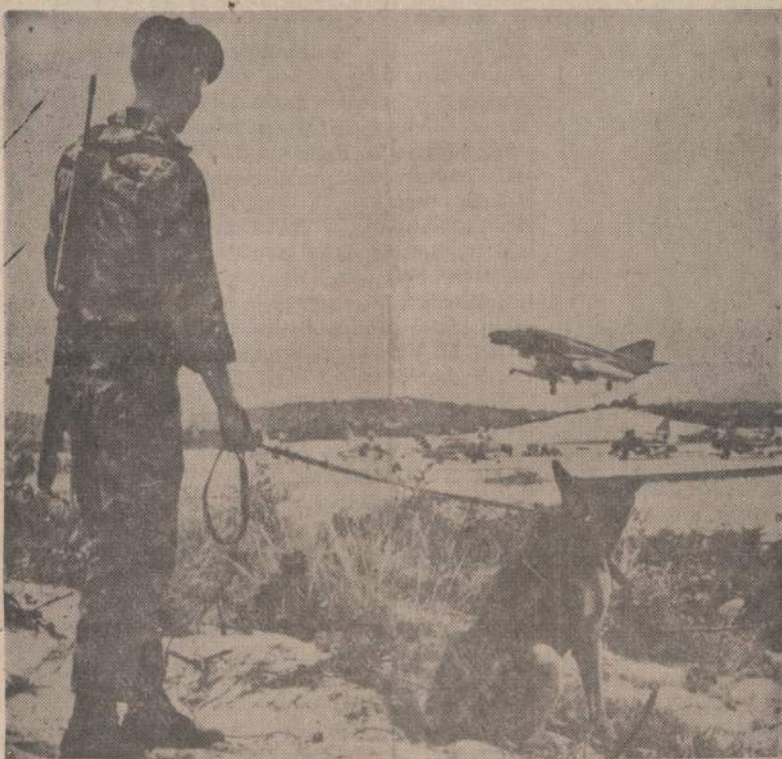
Spalio 26 d. prezidentas Johnsonas atskrido į Cam Rahn įlanką, esančią Pietų Vietname. Jo kelionė buvo laikoma didžiausioje paslaptėje ir buvo dedamos visos pastangos apsaugoti tą vietą, į kurią atvyko prezidentas. Nuotraukoje matosi oro jėgų sargybinis, laikantis šunį, prie karo aerodromo.