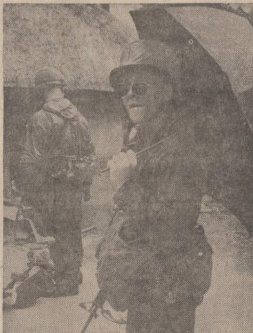
JAV karys Phu Cat srityje akiniais apsaugo nuo aštrios saulės šviesos, o lietsargiu apsaugo nuo staigaus lietaus. Priselinę komunistai ir toliau užpildinėja Amerikos ir Vietnamo karus.