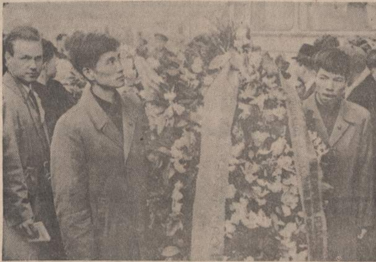
Sovietų valdžia įsakė Kinijos studentams išvažiuoti iš Maskvos. Kiniečiai atnešė didelius vainikus, kuriuos norėjo padėti prie Lenino ir Stalino kapu, bet sovietų policija neleido kiniečiams įžengti į mauzoliejų arba priartėti prie Stalino kapo.

tojų, tačiau konflikto su juodaisiais atveju, jie būtų gan kietas riešutas prastai organizuotiems ir ginkluotiems Afrikos juodiesiems.