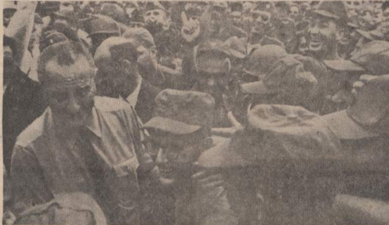
Nuvykęs į Pietų Vietnamą, prezidentas Johnsonas nepraleido progos susitikti su Amerikos kariais ir su jais pasisveikinti.

Knygos pavadinimas paimtas iš garsios Cicerono kalbos prieš Kataliną — „Kaip ilgai bandysi, Katalina, mūsų kantrybę?“ Šiomis dienomis sueina 10 metų kai Gomulkos valdžia paleido kardinolą Višinskį iš kalėjimo, kur jis praleido tris metus. Per visą tą laiką kardinolas atkakliai priešinosi komunistinei valdžiai ir ją dažnai savo pamokulose kritikuoja.