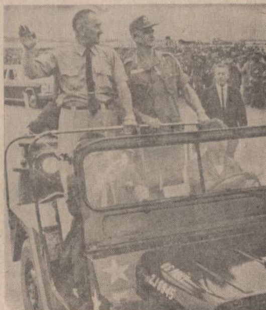
Prezidentas Johnsonas ir Pietų Vietnamo JAV karo jėgų vadas, generolas William Westmoreland, važiuoja automobiliu.

PEKINAS. — Komunistinė Kinija pranešė atšaukianti iš Ghanos savo diplomatus.