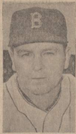
Dick Williams paskirtas Toronto beisbolininkų vadovu.

— Vilniuje rengiasi lietuvių grafikos parodai Belgrade, Jugoslavijoje. Numatoma parodyti 42-jų dailininkų darbų. Iš Jugoslavijos paroda vėliau busiant perkelta Italijon. (E)