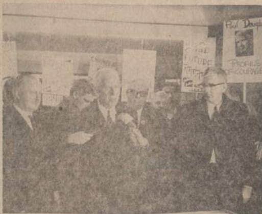
Senatorius Paul H. Douglas kalba lietuvių Demokratų susirinkime Chicagoje.

Lietuvių Komitetas Perrinkti Senatorių Paul H. Douglas