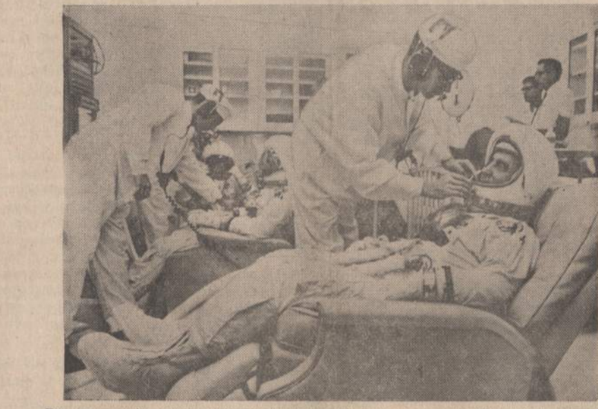
Trys astronautai rengiasi erdvėlaiviu Apolo pakilti į padangę ir praskraidyti bent keturias dienas. Gydytojai ir specialistai tikrina aprangą ir sveikatą vyriausio komandieriaus Virgilio Grissom, vyresnio vairuotojo Edward White ir vairuotojo Roger Chaffee.

CAPE KENNEDY. — Jau baigiami pasiruošimai trečiadienio erdvės kelionei su Gemini 12. Jame skris kapitonas Lovellis ir majoras Aldrinas. Numatoma, kad Aldrinas apie 2 valandas "vaikščios" po erdvę, bus bandoma susijungti su Agena kapsule ir atlikti kiti bandymai. Astronautai erdvėje išbus keturias dienas.