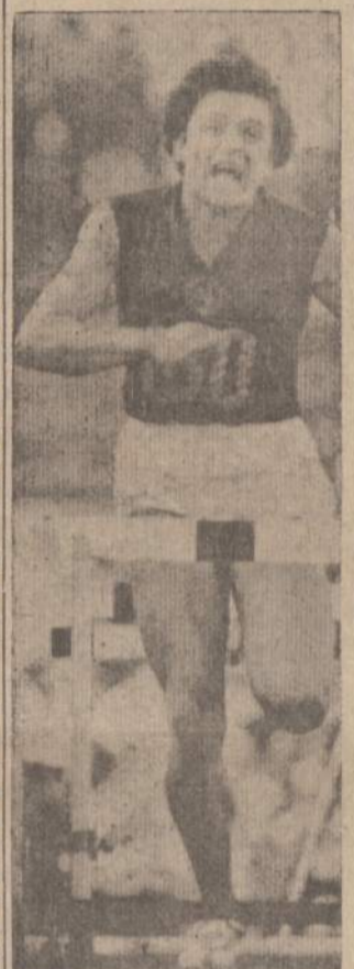
Irina Press, raumeninga - muskulinga Tamaros sesuo, viena iš trijų Sovietų Rusijos "moterų" sporto čempionių, atsisakiusi duotis vengrams patikrinti savo lytį...

Pirmoji inspekcijai pasipriešino Rumunijos rekordinė karti-