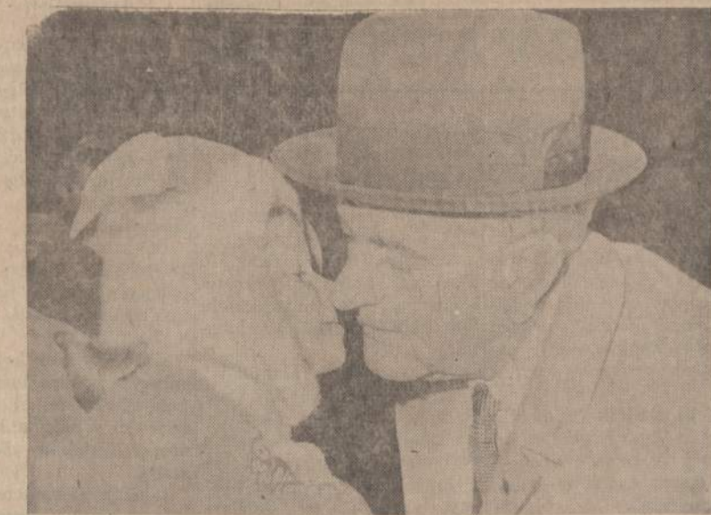
Prezidentas Johnsonas, atskridęs į Alaską, nutarė, jį bus žymiai suvėluota. Laukti atvykusią mergaitę ir paliečia vienas kito re eskimikiškai pasiveikinti. Paaikškina gražiausia jo planuoti rinkimine kampanoj. Washingtono sugrįžęs prezidentas pradė-

Pasitikejimą rodo surinkti virš 140,000 parašų Jaunimo Peticijai, kuri pasiaiko prieš Lietuvos okupantą, smerkdama rusų komunistų kolonializmą. Ar užmiršo paaikškinimą pasirašiusieji, kad šios Jaunimo Peticijos sumanytojas ir vykdytojas buvo