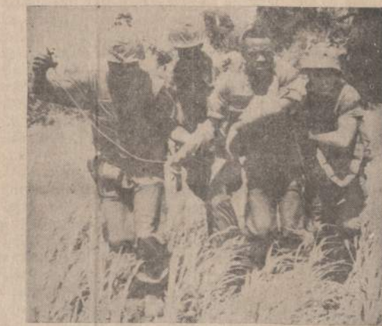
Šiaurės Vietnamo pasienyje, kur ginkluotų vyrų neturėtų būti, komunistai sužaidė vieną Amerikos maršą. Sužeistas paskubomis nešamas į užfoną, kur jam bus suteikta pirmoji pagalba. Bet maršas, jau iš pirmos kovos eilės nešamas, gauna papildomą kraują kiekį.