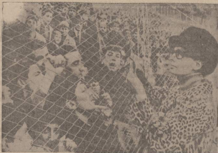
Italai mėgsta futbolą. Bet kai atėjo Sofija Loren, tai josios autografais įiems labiau rūpėjo, negu futbolas.