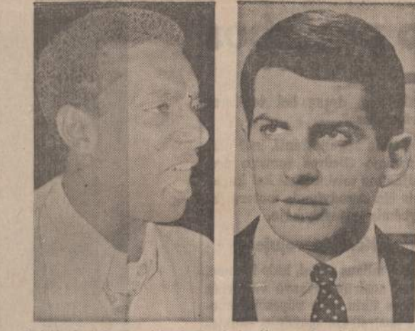
Kairėje Stokely Carmichael, "Judoosios lėgos vadas; dešinėje — aktorius George Hamilton, kuris dažnai yra matomas su prezidento Johnsono dukra Lynda. Tiek vienas tiek kitas ir vėl yra šaukiamas naujųjų emimo tarnybos atlikti karinę prievolę.