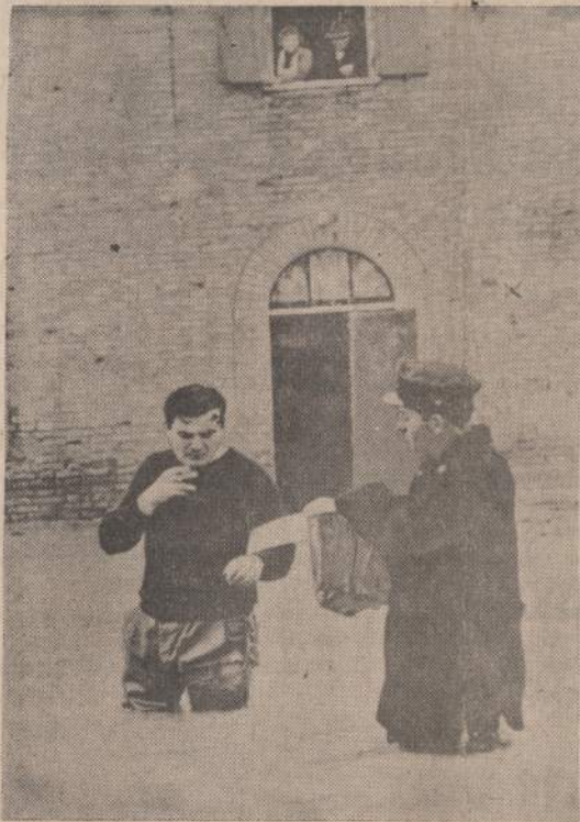
Italijos miestelis Sala Bolognesa dar apsemtas, bet laikanešys, bėsdamas vandeniu, atneša apdrausta liška. Florencijos srityje vanduo jau pradeda atsilošti. Specialistai tvirtina, kad potvynis padarė didelių nuostolių. Jie dar neapskačiuoti.

koalicijos ir atnešė dabartinę vyriausybės krizę. Sugrįžimas atgal galėtų sudaryti įspūdį, kad liberalai tenorėjo pašalinti Erhardą iš kanclerio vietos, o jam pasitraukus, vėl sugrįžo į vyriausybę. Jiems būtų daug patogiaus sudaryti valdančią koaliciją su socialdemokratais. Bet kokio sprendimo nesitikima prieš Bavarijos rinkimus. Daug kas priklausys nuo tų rinkimų rezultatų. Iki tol laikinai valdys kanclerio Erhardo vyriausybė.