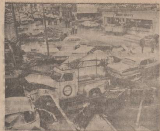
Iowa valstijoje vyko baisios audros, užmušusios 6 gyventojus. Labiausiai nukentėjo Belmont miestelis. Miesto centras visiškai išgriautas, nuostoliai siekia milijonus.

39) Tarybos protokolų klausimė statutas pradeda nuo virtutes, bet ne nuo karvutės. Jis iš karto kalba apie posėdžių