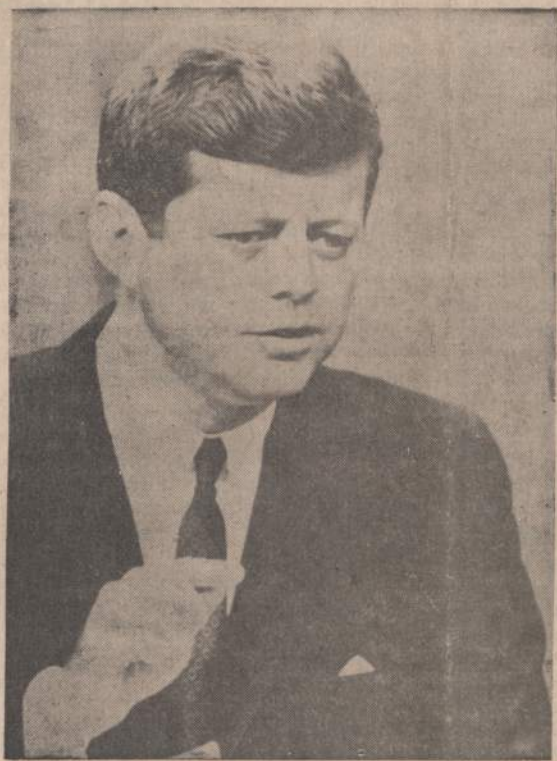
Trisdešimt penktasis JAV prezidentas John F. Kennedy. Gimė 1917 m. gegužės 17 d. Mirė 1963 m. lapkričio 22 d.

PISCATAWAY. — Vieni miestų valdininko rinkimai New Jersey valstijoje buvo išspęsti kortų pagalba. Du kandidatai, gavę vienodą skaičių balsų, nesutiko būti perrenkami, bet iš kortų kaladės traukė "vyriausią" kortą. Vienas ištraukė čyrų keturiukę, kitas pikų devynukę, tuo laimėdamas "townclerk" vietą.