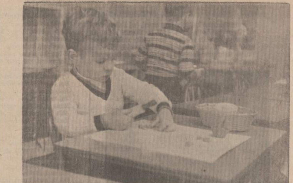
Amerikos Lietuvių Montessori Draugijos Vaikų Namelių auklėtinis dirbdamas su molio lavina rankų žių mūskulais ir kartu vysto savo vaizduotę lipdydamas įvairiausius dalykėlius.

Nesame nė vienu žodžiu nepaieikę draugų ieškojimo, Bet,