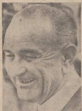
Prezidentas Johnsonas, praleidęs keturias dienas Bethesda, Md., ligoninėje ir iškentejęs dvi operacijas, išėjo iš ligoninės ir išskrido į Texas.