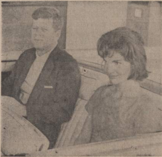
Prezidentas John F. Kennedy ir jo žmona Jacqueline važiuo atidarama automobilyje Dallas (Texas) miesto gatve, kai iš vieno pastato buvo iššauti porą šūvių, kurie mirtinai sužeidė Prezidentą.