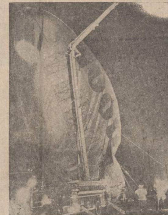
JAV karo jėgų cepelinas bandė nusileisti Los Angeles srityje, bet negalėjo, kai sugedo vienas motoras. Cepelinas užsikabino už elektros laidų ir atsigulė ant žemės. Laimo, kad jame buvo du lakūnai ne-nukentę.

♦ Pietų Vietname komunistų artilerija apšaudė vienos JAV divizijos štabą. Nuostoliai padaryti — lengvi.