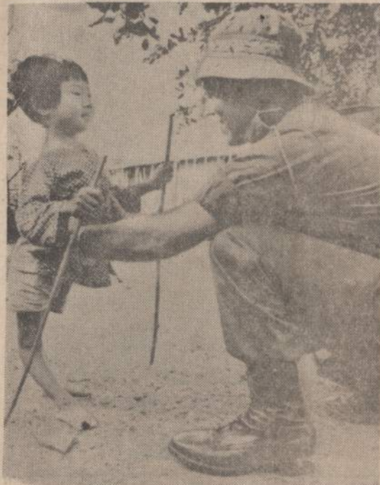
Australijos gydytojai gydo ne vien Vietnamo sužeistus karius, bet ir jaunas mergaites. Paveiksle matoma lenktom kojoms mergaitė galės vaikščioti, kai gaus pakankamai tinkamo maisto.

Žinioms apie memorandumą pasiekus ir nelietuvių sluoksnius, ima rasti pasiteiravimų, siekiančių smulkiau patirti jo turinį. Parūpinami jo vertimai į kitas kalbas. Memorandumo duomenys ir dėstymai, nors tik iš dalies, bet labai vaizdingai atskleidžia Maskvos politikos Lietuvoje kolonistiską pobūdį. (E)