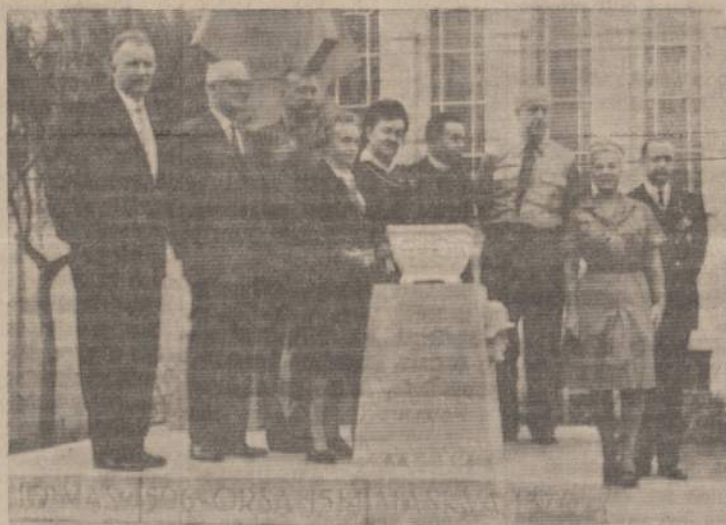
LIETUVIŲ SKAUTŲ SAJUNGOS TARYBOS PIRMIJA