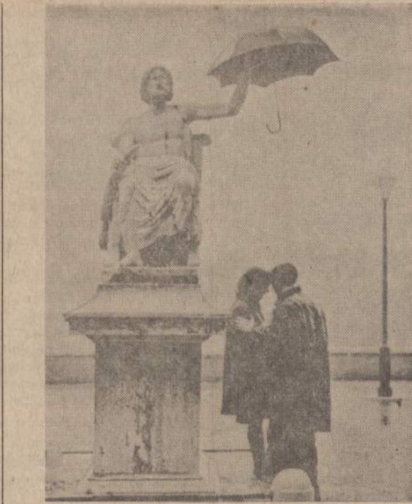
Paskutiniu metu Romoje smarkiai lyja. Jauna pora pasiėmė lietsargį, bet jis kliudė. Jie paprašė imperatorių Tiberijų II palaikyti jiems lietsargį. Visi pripažįsta, jog tai buvo vienas geriausių seno imperatoriaus patarimų.

Štai kodėl šis kongresas pagrindiniu savo darbu ir nuotairais apibudinančiais šūkiu pasirinko ryžtingą šūkį: "Accept the Challenge". Šį šūkį pasiūlė Penn-