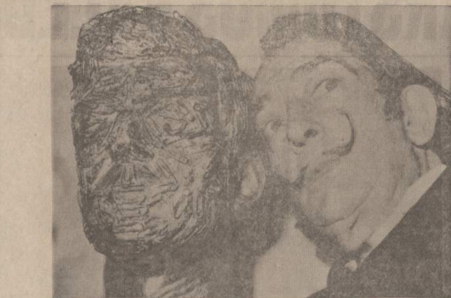
Paryžiuje ispanas menininkas Salvador Dalí nufotografavo buvusio prezidento John F. Kennedy biustą ir grėta jo nufotografavo.

Pagrindiniu šio minėjimo — akademijos kalbėtoju yra iš Či-