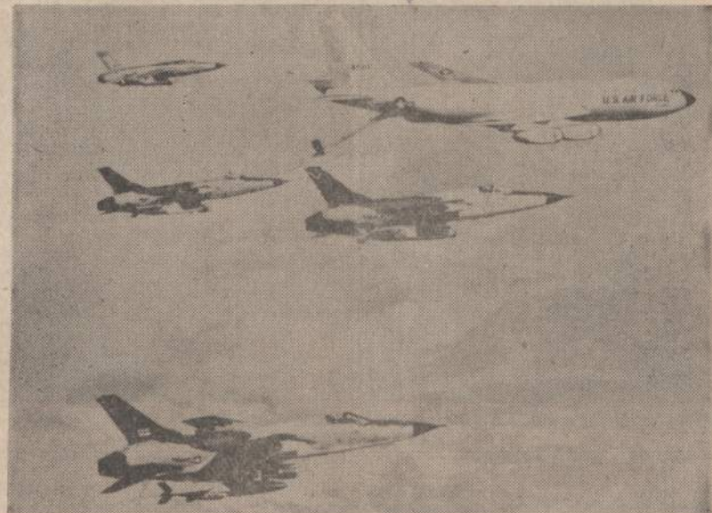
Didieji Amerikos karo lėktuvai, papildę gazolinu atsargas, skrenda į šiaurės Vietnamą. Komunistai labiausiai bijo šių galingų lėktuvų, nes nuo jų bombų negalima pasislėpti.

Apie seimo darbus ir nutarimus bus plačiau vėliau.