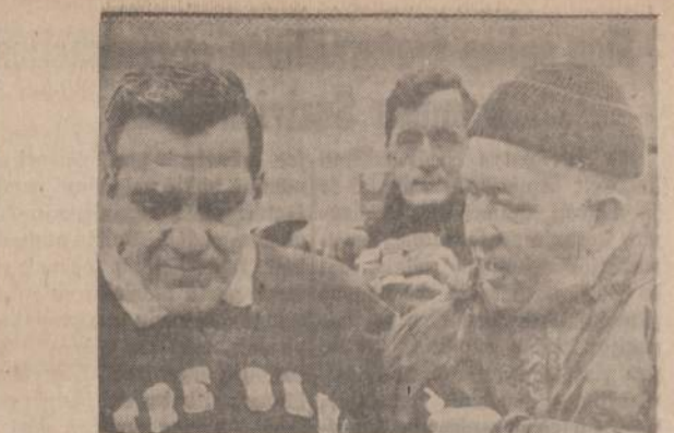
Notre Dame ir Michigan State futbolininkai East Lansing, Mich., aikštėje.