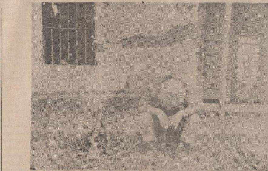
Pietų Korėjos marinas, kovų metu gerokai išvargęs, naudoja mūšiu pertrauką kelių minučių poilsiui.

Vakar Čikagoje Richardas Speckas jau 11 kartą pasirodė teisme su savo advokatais. Buvo sudaroma juri komisija, kuri nustatys ar jis turi pilną protą. Speckas yra kaltinamas 8 gailėstingųjų seserų nužudymu.