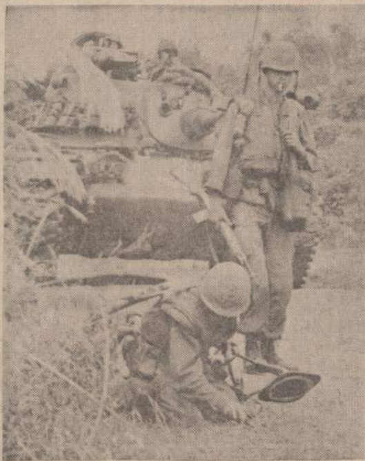
Vienas marinas tikrina, ar kartais komunistai nepadėjo minv, kitas saugo jį, o tankas laukia nuvalyto kelio.

Sis susitikimas buvo pirmas su Mig-19. Rugspiūčio mėnesį Izraelio Mirazai numušė vieną Sirijos Mig-17 ir vieną Mig-21. Liepos mėnesį Sirija neteko kito Mig-21. Jordanas neteko britų gamybos Hunterio lapkričio 13 d. Iki šiol Izraelis neprarado nė vieno savo lėktuvo. Vienas Mig-21 pateko Izraeliui, kai Irako lakūnas su juo pabėgo į Izraelį. Tai buvo pirmas sovietų modernus Migas patekęs į vakarų valstybių rankas.