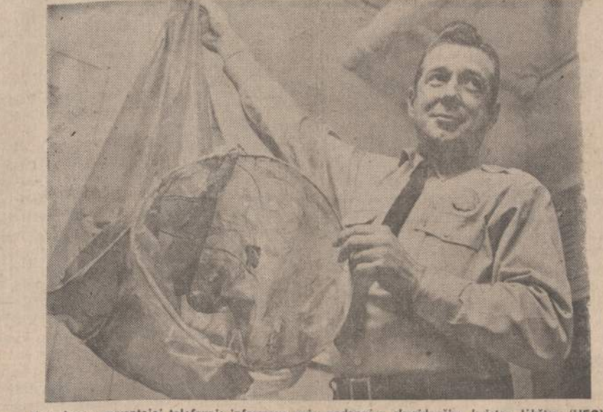
New Jersey gyventojai telefonais informavo apie padangėse skraidančias keistas lėkėtes (UFO). Kai ta "lėkštė" peršauta nukrito, tai paaiškėjo, jog tai buvo paprastas plastinis balionas, kurį vietos policininkas visiems rodo.

MASKVA. — Sovietų Sąjunga ir Indija pasirašė naują prekybos sutartį.