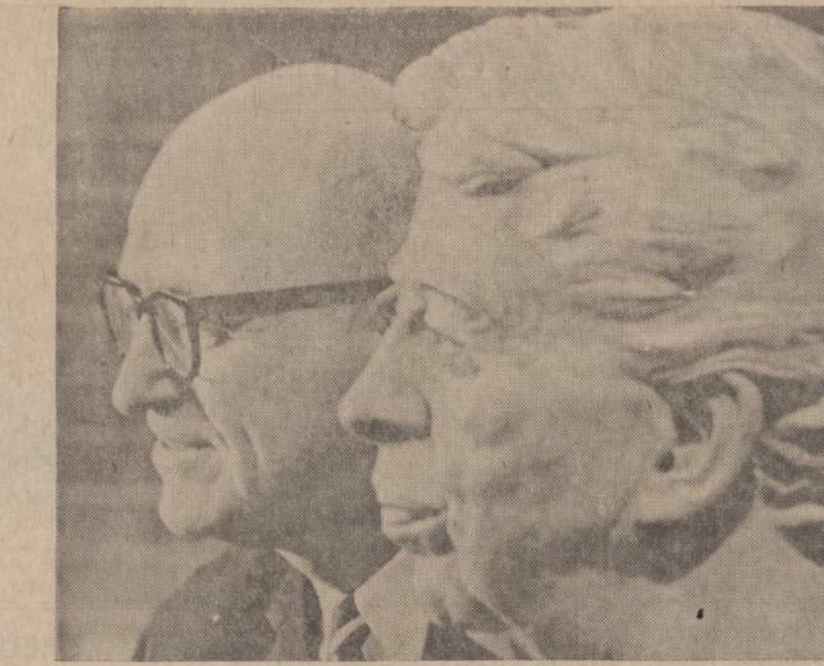
Vyriausias Rooseveltų sūnus James nusifotografavo šalia jo motinai padaryto biusto.

Filmo tema, pasakoja mūsų tautietis Jonas Mekas, yra gyvenimas bohemiškame New York'o viešbutyje. Jame parodomai: meilūžiai, narkotikų adiktai, homoseksualai, "lesbians ir heterosexuals". Filmas, atseit, gyvenimiškas ir padarys gero pinigą. Gailla tik, kad lietuviškas talentas neranda sau kitų kūrybinių kelių.