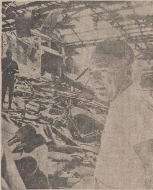
JAV ambasadorius Henry Cabot Lodge Saigone apžiūrinėja komunistų išgriauta miesto teatras, kuriame naktvedavo JAV kariai. Sprogimo metu buvo sužeista 11 Amerikos karių.

Kritikai nurodo, kad organizacijos viešpatuojant chaosui, didžiosios galybės vis dažniau sau svarbius reikalus ims spręsti abipusiai pasitarimais be Jungtinių Tautų, kas sumažins jų reikšmę ir reikalingumą.