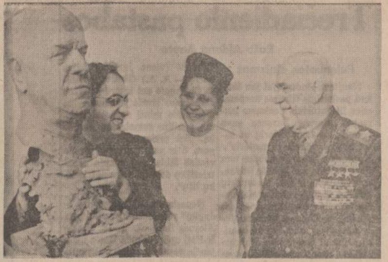
Sovietų maršalas Georgi Žukovas buvo atleistas iš krašto apsaugos ministerio pareigų, bet paskutinėmis savaitėmis sovietų spauda ir vėl mini jo vardą. Paveikslė matome maršalo Žukovą, su žmona besidžiaugiančius armėno padarytu maršalo biustu, kai jis minėjo 70 metų sukaktį.