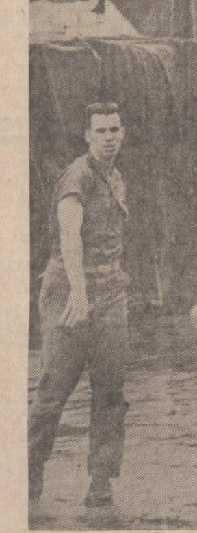
1963 metais geriausias futbolininkas buvo Roger Staubach (kairė). Šiandien jis Da Nang bazėje prižiūri sandėlius. Futbolo pažiūri jis retai gauna progos.