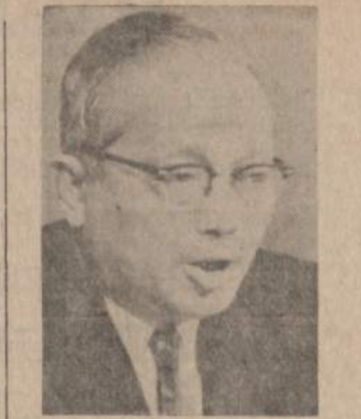
Diplomatas U Thant vienbalsiai išrinktas Jungtinių Tautų sekretoriaus pareigoms. Paveiksle jis sako kalbą susirinkusiems atstovams.