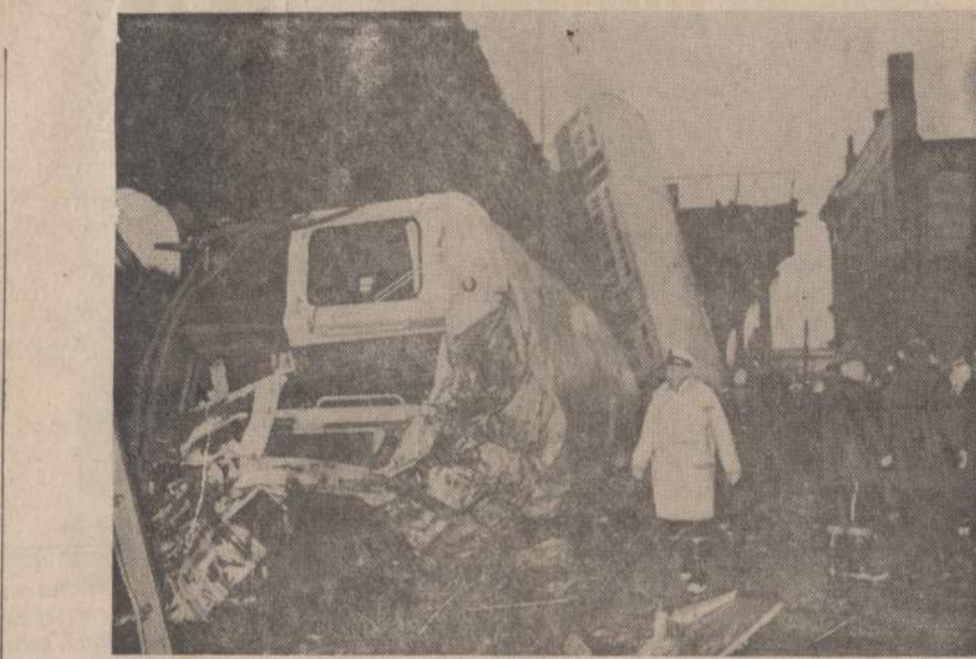
Gruodžio 7 d. Čikagoje iškeltais bėgiais einantis traukinėlis nuoko nuo bėgių ir vienas vagonas nukrito žemyn. Nelaimėje žuvo vienas keleivis ir daug buvo sužeisti. Nelaimė įvyko anksčiau, kai daugelis keleivių važiuojo į darbą.