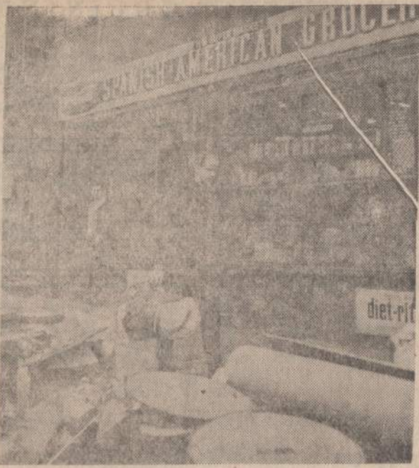
Laurence Rockefeller, turtingiausias šeimos jaunuolis, vyksta į New Yorko Harlemą, kad galėtų padėti portorikiečiams, kaip įsikurti New Yorke.