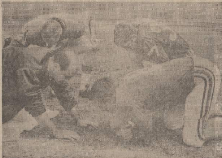
St. Louis kardinolai nesimeldžia, kad laimėtų rungtynes, bet ieško smėlyje pamesto 1 stikluo.

♦ Amerikos pussunkio svorio bokso čempionas portarikietis Jose Torres, kuris gins savo titulą prieš Dick Tiger gruodžio 16 d. Madison Square Gardens,