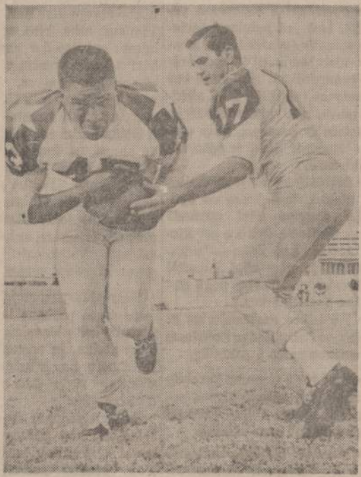
Dallas mieste įvyks lemiamos futbolininkų rungtynės. Paveiksle matome du geresnius žaidėjus.

TERRAS ADRESAS: 3237 WEST 63rd STREET, CHICAGO, ILLINOIS TELEFONAS — 434-4660