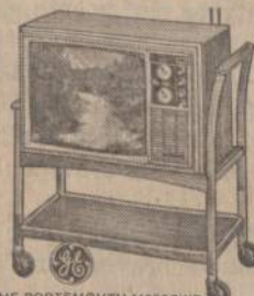
THE PORTSMOUTH M258CWD