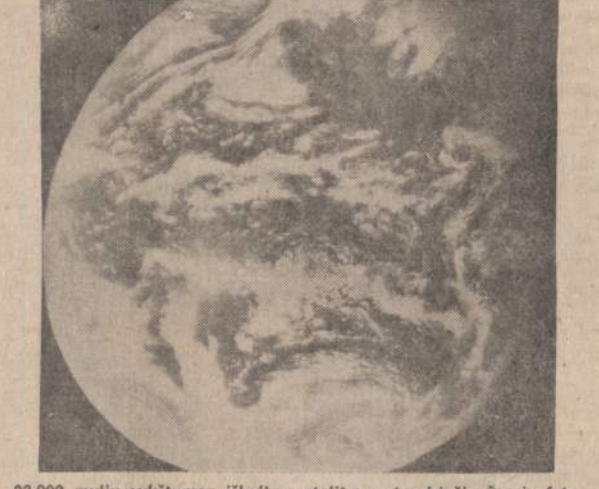
23,000 mylių aukštumon iškeltas satelitas nutraukė šią Žemės fotografiją ir persijuntė į Roseman, N. C., technologijos centrą. Paveikslas linais Pacifiko, prie ekvatoriaus. Matosi beveik visas Žemės rutulys. Kairėje paveiklo pusėje matosi saulės nušviesto vietos, o dešinėje diena jau eina į vakarą. Tai pirmoji tokia Žemės fotografija.

HOLLYWOODAS. — Policija suėmė 16 asmenų, kurie protestavo prieš miesto valdybos uždraudimą jaunuoliams vakarais rinktis Sunset Boulevard rajone.