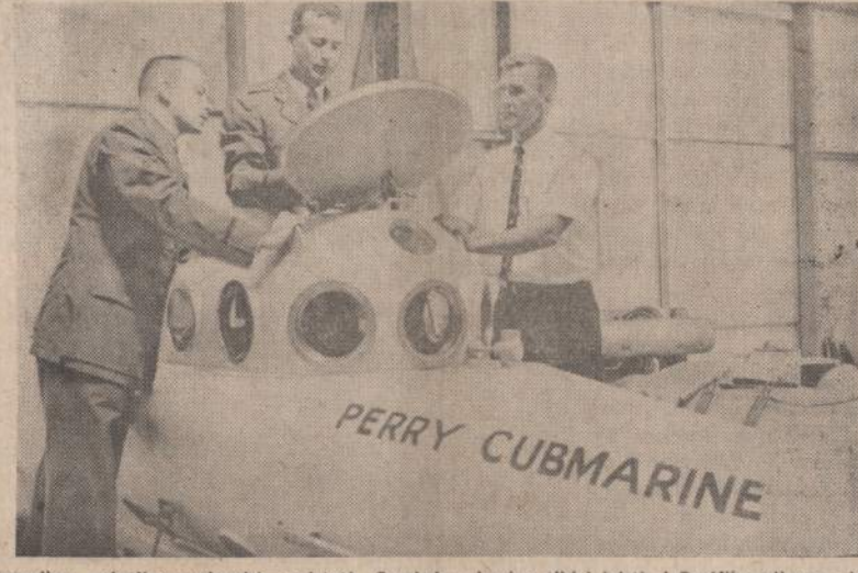
Amerikos aviacijos vadovybė pasistatė Cumbrina, kuriuo tikisi leisti į Pacifiko gilumas, jeigu karo metu atsiras reikalo. Aviacijos ekspertai tikrina mažytį, bet galingą nardlaivį.

RIJADAS. — Saudi Arabija, Kuveitas ir Jordanas sudarė planus statyti naują kelią, kuris jungtų visas tris valstybes.