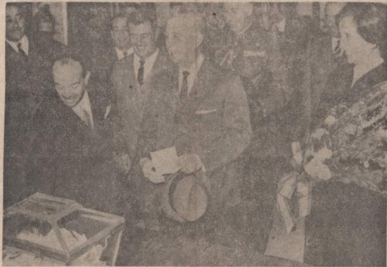
Ispanijos diktatorius gen. Franco balsuoja jo paties paruoštą naują "konstituciją", kuri duosianti gyventojams truputį daugiau teisių. Balsavimas taip sutvarkytas, kad piliečiai gali tikrai "taip" balsuoti. Diktatoriui nepritariantieji negali balsuoti "ne".

Pridėjus prie visų šių teisių dar laisvę keliauti, kur nori, Rytų Vokietijoje atsirastų sąlygos, kuriose abiejų dalių susijungimas būtų tik laiko klausimas.