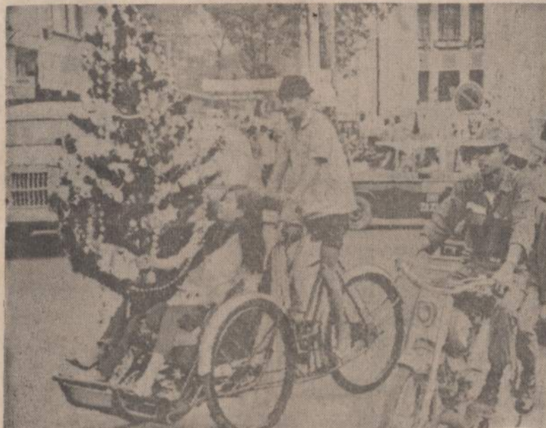
Saigone, mergaitė nusipirkusi kalėdų eglutę, skuba namo. Krašte vyksta komunistų sukeltos žiaurios žudynės, bet sostinėje gyvenimas eina normaliu būdu.

Amerikiečių kariniai slauginiai tvirtina, kad puolant karinius taikinius Hanojaus apylinkėse, priešas iššovė apie 100 sovietų gamybos priešlėktuvinių raketų. Greičiausiai, tos raketos, kridamos atgal žemėn ir padarė nuostolius Hanojaus gyvenamiems rajonams. Vien tik trečiadienio puolimuose buvo sukaičiuotos 57 sovietų raketos. Per visą karą tik apie 150 tokių raketų buvo iššauta, taigi, praėjusį savaitę jų buvo pavartota labai daug. Kiekviena jų sveria po 3,000 svarų, taigi galėjo padaryti gyvenamiems namams ir gyventojams žalos.