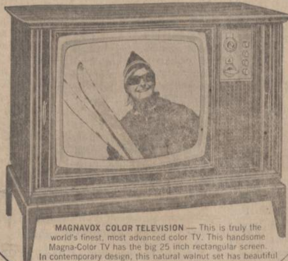
MAGNAVOX COLOR TELEVISION — This is truly the world's finest, most advanced color TV. This handsome Magna-Color TV has the big 25 inch rectangular screen. In contemporary design, this natural walnut set has beautiful Tambour doors and elegance beyond expectation... it's on display in our lobby.

A drawing for 7 grand prizes will be held on Saturday, January 28 at 12 o'clock noon. There is no contest to enter — no guessing, or jimmicks to write — anyone may enter. Simply stop in, fill out a registration card and place it in the grand prize drawing box. Winners need not be present at drawing — you will be notified by mail. Come in and register early.