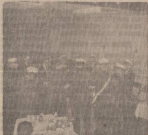
LJS Korp. Gintaras devynerių metų veiklos iškilmingos sukakties minėjimas — iškilnių momentas — naujųjų korporantų prijungimas prie senjorų