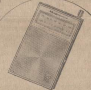
MAGNAVOX AM/FM POCKET TRANSISTOR In a handsome leather carrying case this 11 transistor radio comes complete with a long life battery (125 hours) and "no drift" tuner which keeps stations "locked-in".

NEW HIGH RATE 4 3/4% ANTICIPATED RATE EFFECTIVE JANUARY 1, 1967 ON INVESTMENT SAVINGS ACCOUNTS