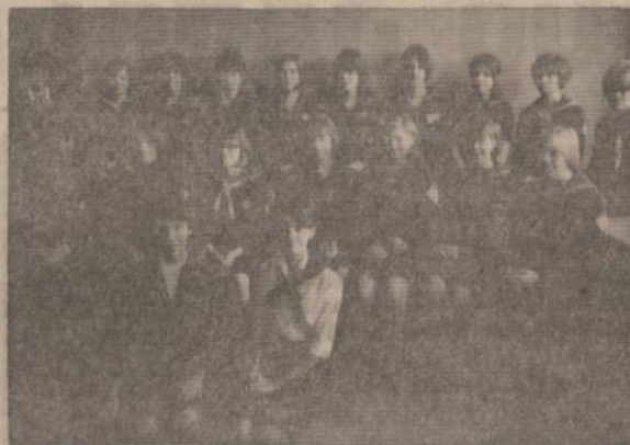
LJS Juodkrantės tunto Vaivų laivas sveikos metu