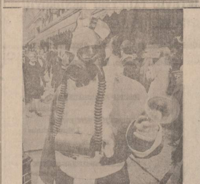
New Yorke Kalėdų Senelis taip apsirengę, kad jis galėtų išlikti sausas lietaus, sniego ir smogo metu.