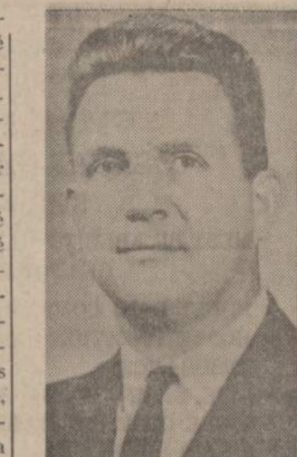
Buffalo sportininkas Lou Saban grįžta į American Football Lyge, kur bus instruktorium.

"NAUJIEŅOS" KIEVIEŅO DAPAS ŽMOGAUS DRAUŽAS IR BIČIULIS