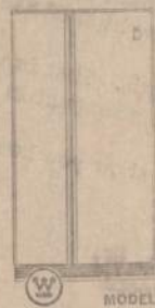
Also Available Westinghouse 22.1 Cu. Ft. Side-By-Side Refrigerator and Freezer Model RSH220 (Without Automatic Ice Maker)

GLASER'S FURNITURE AND APPLIANCE COMPANY 5115-5123 SO. KEDZIE AVE. PProspect 6-1790 OPEN MONDAY AND THURSDAY EVENINGS